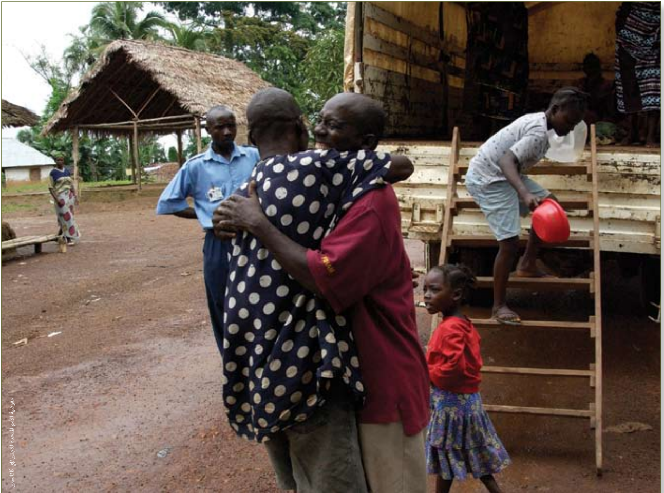
العودة الطوعية للاجئين من سيراليون من ليبيريا. تموز/يوليو ٢٠٠٤

تضم القائمة التي أعدتها مفوضية الأمم المتحدة لشؤون اللاجئين لحصر اللاجئين الذين يعيشون حالة لجوء مطولة (وهي الحالة التي يعيشها أكثر من ٢٥٠٠٠ لاجئ في المنفى لمدة تزيد عن خمس سنوات) في أفريقيا جنوب الصحراء الكبرى ٢,٣ مليون لاجئ من ثمانية بلدان هي أنغولا، وبوروندي، وجمهورية أفريقيا الوسطى، وجمهورية الكونغو الديمقراطية، وإريتريا،