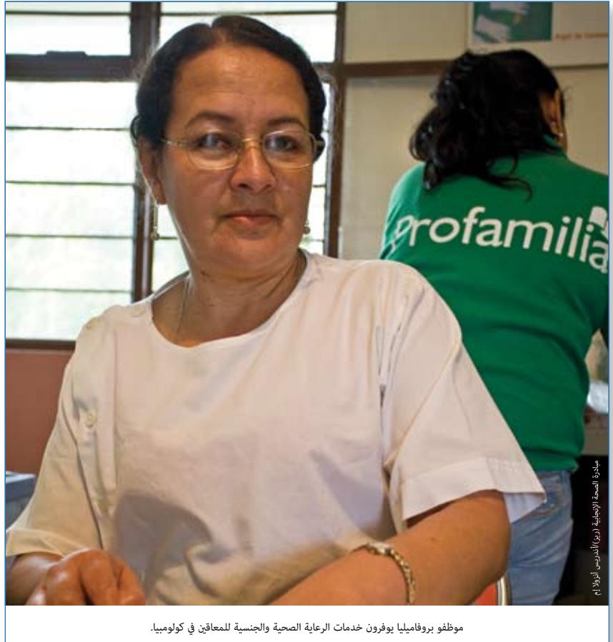
موظفو بروفاميليا يوفرون خدمات الرعاية الصحية والجنسية للمعاقين في كولومبيا.

وفي المناطق الريفية، نجد المشاكل الصحية للنازحين تتفاقم نتيجة لغياب الاستفادة من الخدمات. ويأتي النازحون داخلياً مشتتون بشكل كبير على امتداد المناطق المختلفة، وتأتي البنية التحتية للخدمات الصحية، خاصة في الشريط المطل على المحيط الهادئ، محدودة للغاية. ويشكل الكولومبيون الأفارقة والريفيون الجانب الأكبر من السكان النازحين. وإدراكاً منها لكون تلك الفئات هي الأكثر