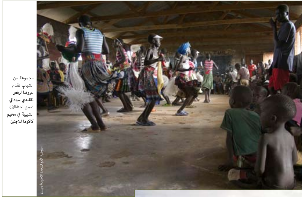
مجموعة من الشباب تقدم عروضاً لرقص تقليدي سوداني ضمن احتفالات الشبيبة في مخيم كاكوما للاجئين

ولنأخذ مثال المقامرين. فعلى الرغم من أن المقامرين لا يصلحون أن يكونوا قدوة حسنة، إلا أن سلوكهم