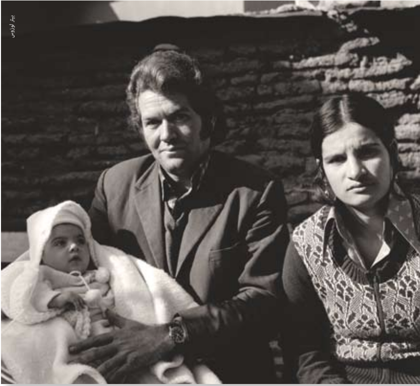
زوجان من أرغاكا مع طفلهما، ١٩٧٥

البعض في أعراس ومآتم القرية. وأخيراً، فقد كانت هناك عدة مناطق يتركز فيها أهل أرجاكي السابقون، مما خلق نماذج مصغرة من القرية.