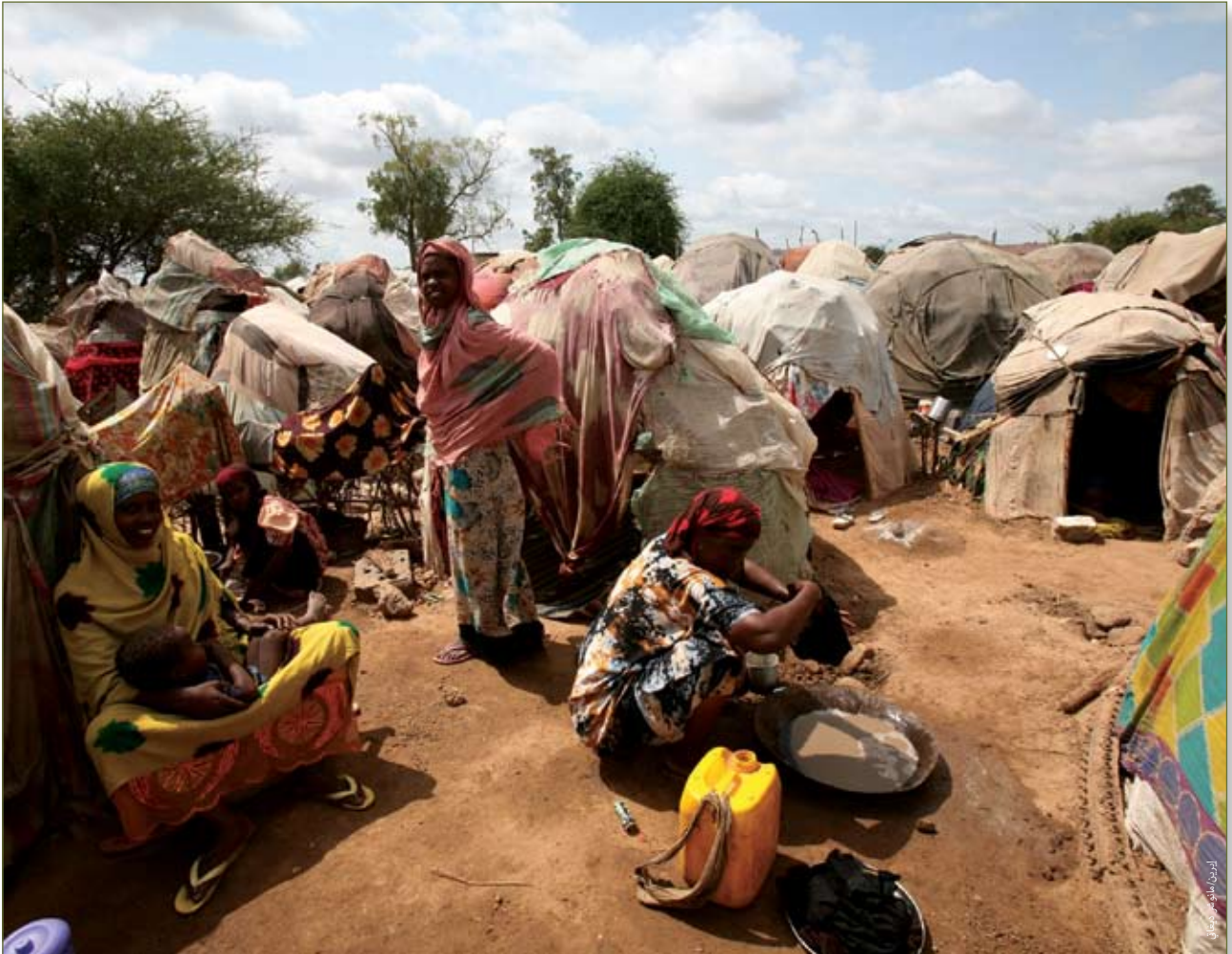
نساء وأطفال نازحون في مخيم شيخ عمر في جوهر في الصومال، أيلول/سبتمبر ٢٠٠٩

ولكن وفقاً لرؤى العاملين في مجال المساعدات، فقد أدت الرواية الشائعة عن الأزمة الدائمة في الصومال إلى انتشار نوع من الجهل الوظيفي بين