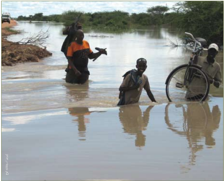
فيضانات في دداد في كينيا، نوفمبر ٢٠٠٦

منذ فترة طويلة تعود إلى عام ١٩٩٩، كتب الفريق الحكومي الدولي المعني بتغير المناخ أن أخطر آثار تغير المناخ قد تكون تلك المتعلقة بالهجرة البشرية، إلا أن الدول لم تعالج ذلك في المفاوضات والاتفاقات المعنية بتغير المناخ. وبينما تركز التزامات بروتوكول كيوتو التي تستمر حتى عام ٢٠١٢ على الحد من تغير المناخ، سوف