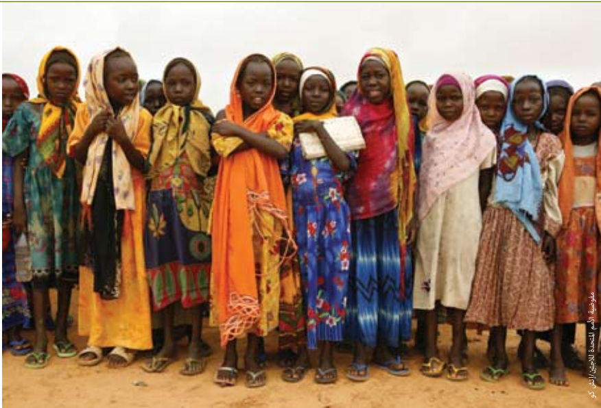
لاجئون دارفوريون يجمعون في باحة المدرسة في مخيم جبل في التشاد للتسجيل للسنة الدراسية المقبلة.

لقد تغيرت الشبكات والهياكل الاجتماعية إلى درجة أن الثقة في المستقبل لم تعد مضمونة وأصبح 'التخزين' - ويقصد به إبقاء اللاجئين في حالات ممتدة من الحركة المقيدة والبطالة الإجبارية والتبعية، أي تعليق حياتهم إلى أجل غير مسمى ٥ - أسلوب الحياة الطبيعي لهؤلاء الدarfوريين. ولكن يتعين على صناع السياسة أولاً إنهاء الصراع في دارفور، وعندئذ سيحتاج إنهاء حالة النزوح التي طال أمدها إلى استثمار المجتمع الدولي استثماراً طويل الأجل في إعادة بناء طريقة الحياة التي كانت قد دُمرت.