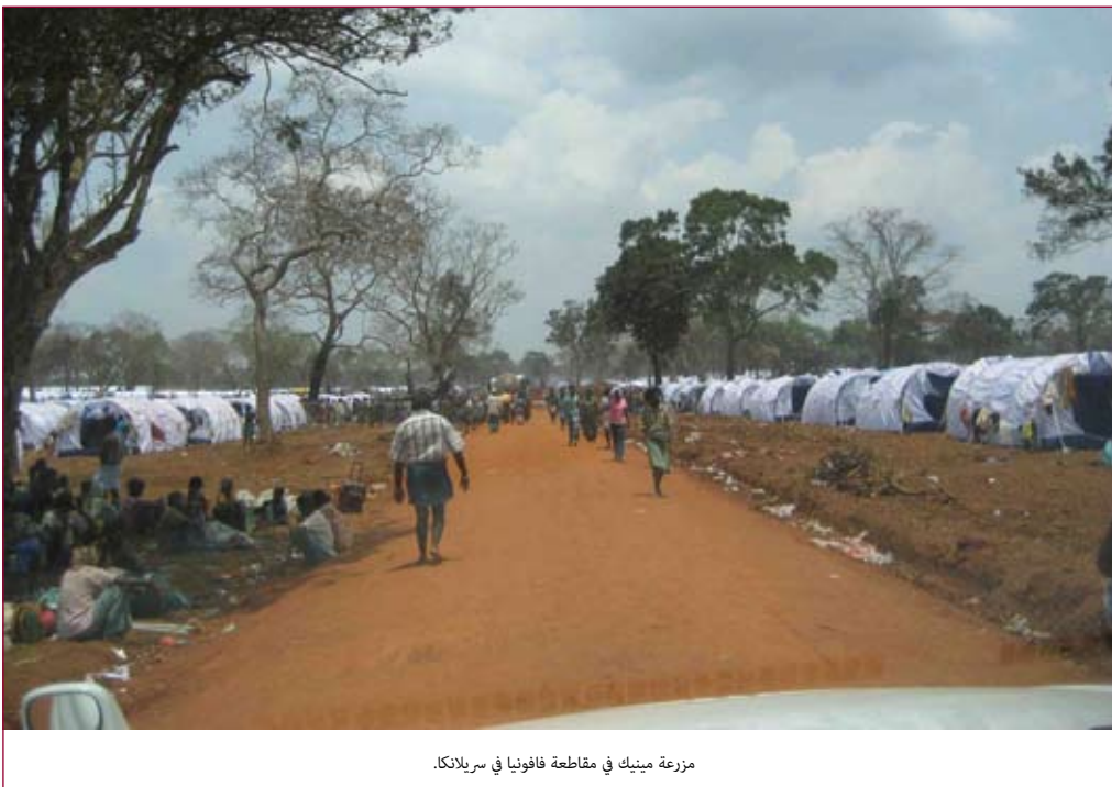
مزرعة مينيك في مقاطعة فافونيا في سريلانكا.

وفي منتصف يوليو/تموز ٢٠٠٩، كان هناك ٣٠ مخيماً للنازحين داخلياً تخضع لإدارة الجيش وحمائته في مناطق فافونيا ومانار وجافنا وترينكومالي. ولا يُسمح للنازحين داخلياً بمغادرة المخيمات إلا للحصول على الرعاية الطبية الطارئة أو غير ذلك من الأسباب العاجلة كحضور جنازة (وحتى هذه الحالات غالباً ما تكون تحت حراسة عسكرية). ولم يُسمح رسمياً