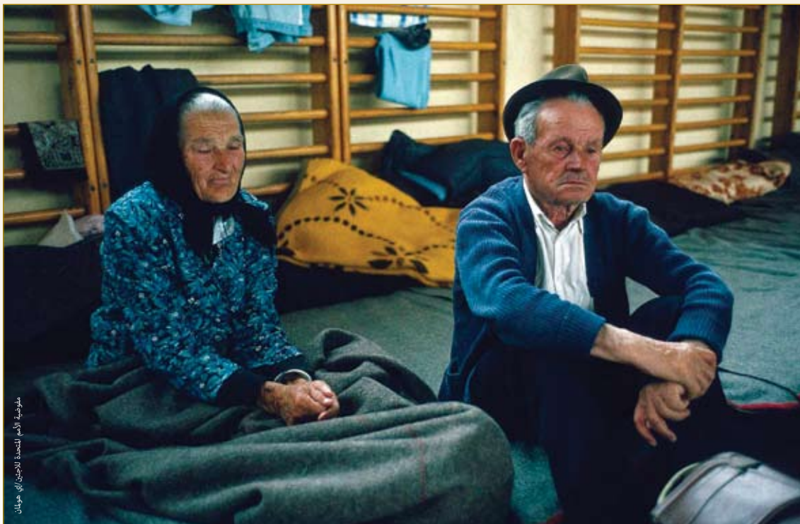
لاجئون من البوسنة والهرسك في المركز الرياضي في شرمشكا ميتروفيتشا في دولة الصرب.

■ المباني والمرافق المقامة من أجل الإشغال القصير أو الموسمي لها، مثل الفنادق والمنتجعات المائية الصحية والمخيمات الصيفية ومخيمات الرعي الموسمية.