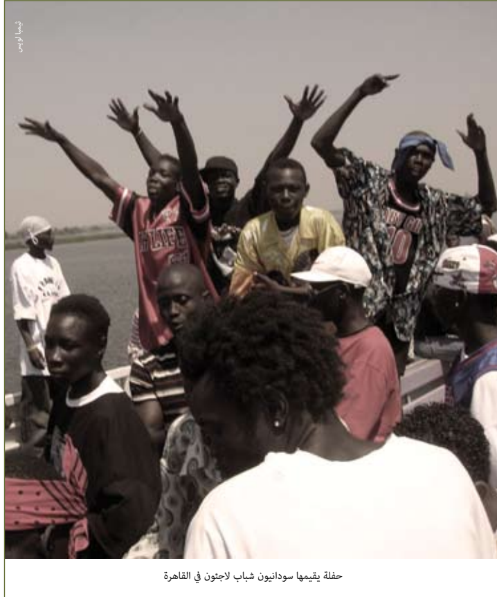
حفلة يقيمها سودانيون شباب لاجئون في القاهرة

كما يؤكد الانضمام إلى العصابات على الشعور بالانتماء إلى مجتمع أكبر بكثير وعابر للحدود الوطنية. إذ تملك جماعتين من الجماعات الموجودة في القاهرة أعضاء في بلدان إعادة التوطين في مختلف أنحاء العالم (وكذلك في السودان)؛ حيث تؤدي تجربة الهجرة في حد ذاتها