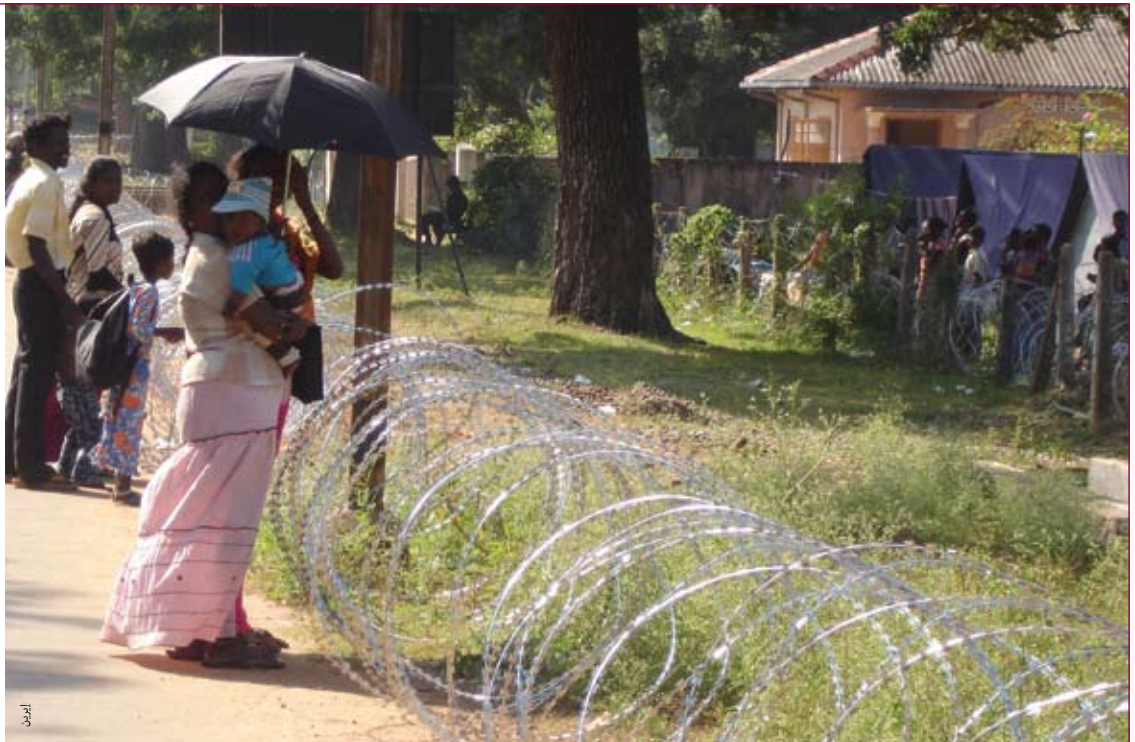
امرأة شابة من التاميل تحاول التحدث مع أفراد عائلتها في أحد مخيمات النازحين داخلياً في بلدة فافونيا في شمال سريلانكا والتي تستضيف ١٦ مخيماً من هذه المخيمات والتي أنشأتها الحكومة.

على الرغم من ضخ المجتمع الدولي عشرات الملايين من الدولارات في مخيمات ومواقع النازحين داخلياً في سريلانكا، إلا أن بعض المنظمات الإنسانية لا تزال تواجه صعوبات وتأخيرات في الوصول إليها في الشمال وكذلك في الشرق