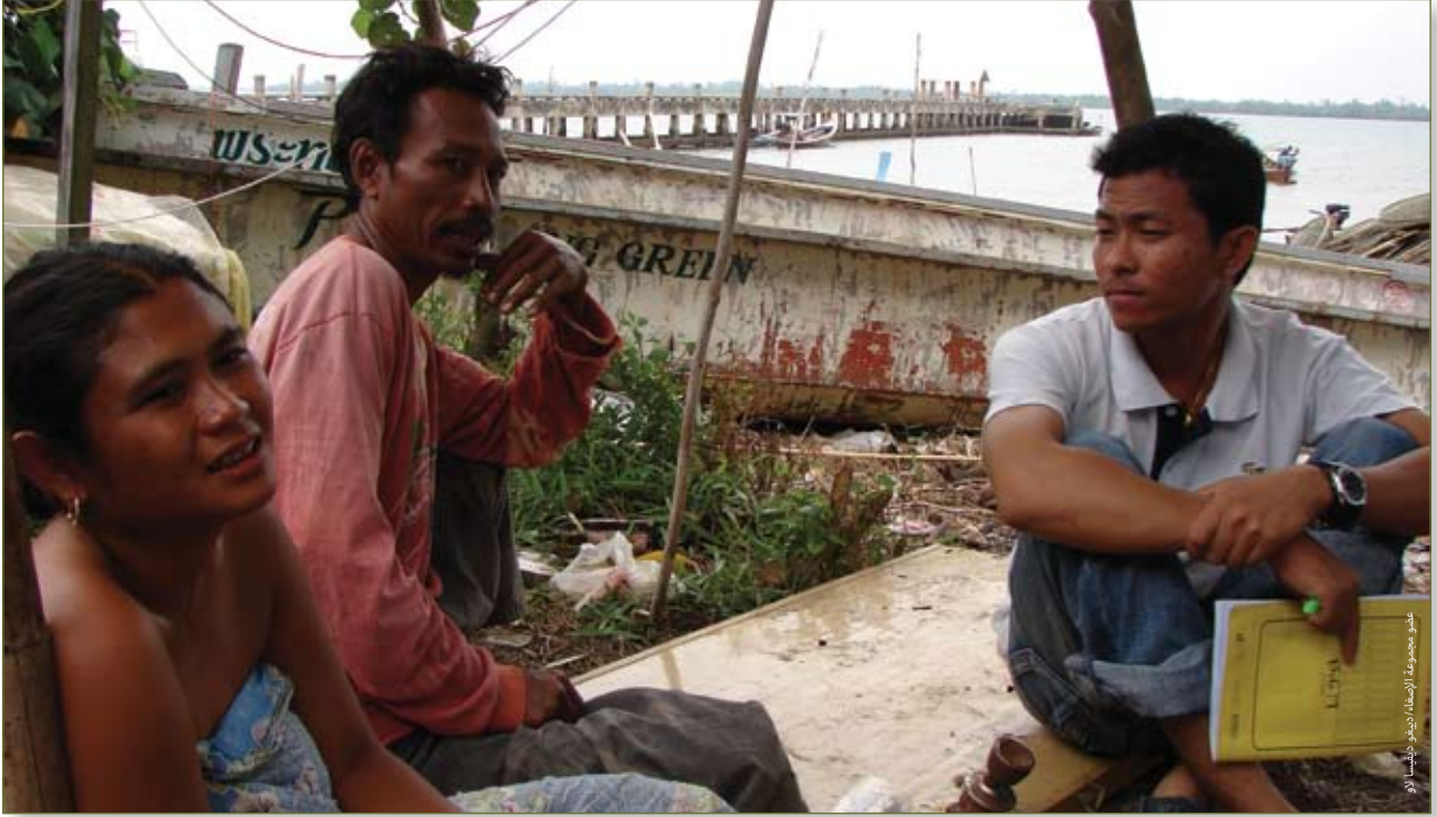
تمارين إصغاء في تايلاند سنة ٢٠٠٧

ورغم ذلك، فإن الاهتمام بالضروريات التي تنشأ - مثل الحاجة لمساعدة الناس على العودة إلى منازلهم بأمان وضمان تمتع كافة المحتاجين بالدعم المناسب، وضمان أمن وسلامة النازحين - من شأنه أن يُمكن العاملين مع النازحين في أوضاع النزوح الممتدة من تفادي الأخطاء المتكررة والتي يكون لها آثار طويلة الأمد على حياتهم.