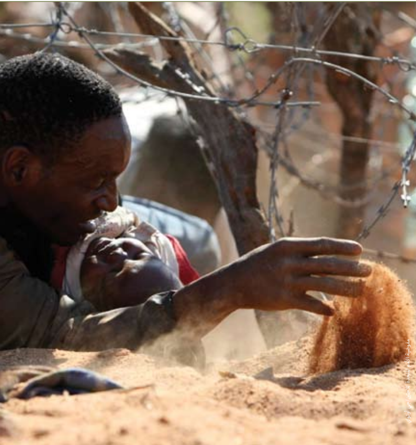
منظمة الهجرة الدولية

رجل مع طفل صغير يزحفون تحت الأسلاك الشائكة على الحدود الزيمبابوية الجنوب إفريقية.