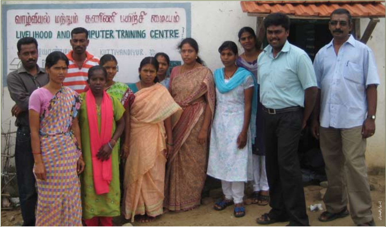
موظفو أوفر مع متطوعين هنود خارج مركز مجتمعي في مقاطعة ناغاباتينام

تتقيد القرى التي تخدمها بشأن الخدمات الحكومية المتوفرة لأفرادها. ومن ثم فقد اضطلع اللاجئون بدور غير معتاد في المساعدة كقناة إعلامية لتحقيق التواصل بين الحكومة المضيفة والسكان المحليين.