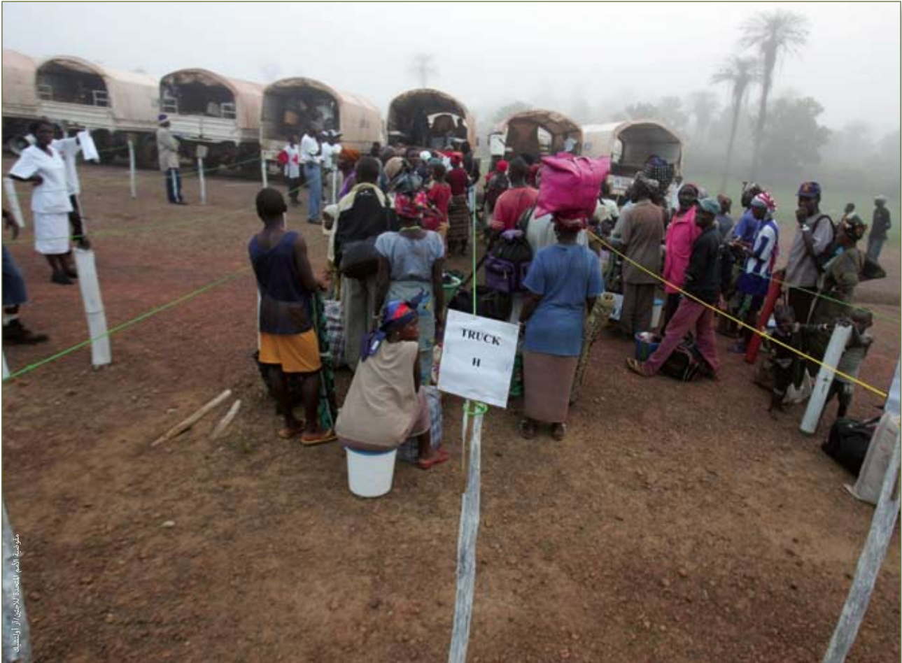
العودة الطوعية للاجئين من سيراليون من ليبيريا، تموز/يوليو ٢٠٠٤

وفي الوقت نفسه، أدى مزيج من العوامل، هي عودة السلام والاستقرار وتحسن الأداء الاقتصادي في العديد من دول الجماعة والرغبة في المزيد من