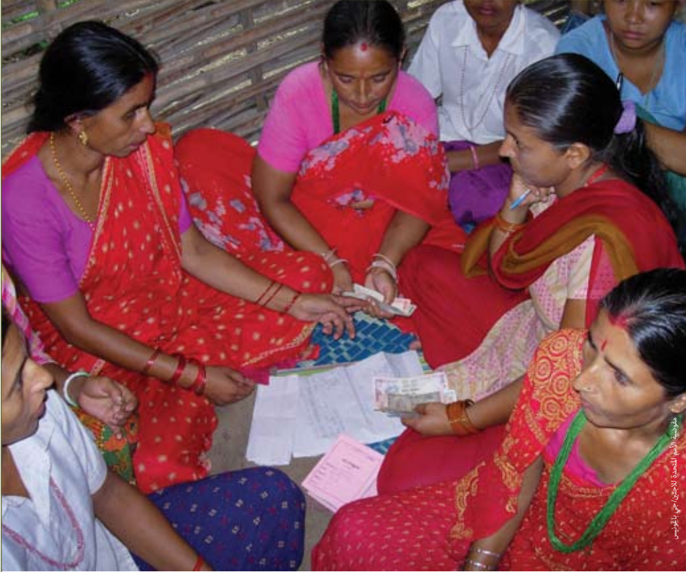
لاجئات بوتانيات في مخيم تيميا في شرق نيبال يشاركن في برنامج التمويل المتناهي الصغر والذي يوفر لهن قروض تسمح لهن بتأسيس أعمال تجارية صغيرة مستقلة.

التمويل الأصغر: يتعرض النازحون الفقراء - والفقراء بصفة عامة - لمخاطر أكبر مما يتعرض لها غيرهم من الفئات، وتؤثر فيهم الصدمات الاقتصادية بشكل أكثر عمقاً من تأثيرها على غيرهم. فهم يحتاجون لمنتجات تأمينية تكون منخفضة التكلفة وتلبي احتياجاتهم، وقد تشمل هذه المنتجات التأمين على الحياة أو الضمانات على القروض الصغرى لحمايتهم في حالة عدم قدرتهم على سداد ديونهم، والتأمين على الممتلكات لحماية الممتلكات القليلة التي لديهم، أو غيرها من المنتجات التأمينية المتخصصة التي تقلل من هشاشة واقفهم الاقتصادي. ويمكن للآليات منخفضة التكاليف مثل التأمين الأصغر أن تعينهم على تحمل الهزات الاقتصادية وغيرها من نوائب الدهر الأخرى وتزيد من استقرار أوضاعهم على المدى الطويل.