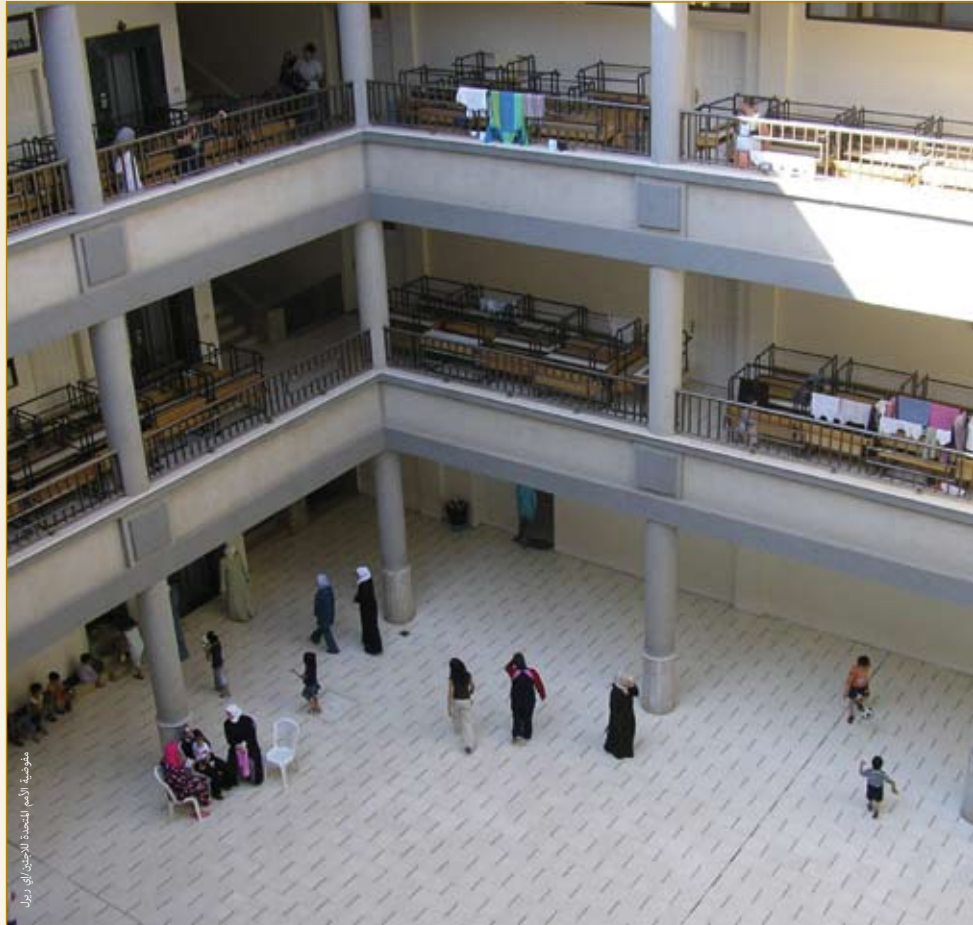
حوالي ٥٠٠ لاجئ لبناني فروا نتيجة للعنف يقيمون في مدرسة الشريعة الثانوية في جنوب دمشق، سوريا.

لا تتوافر لدينا أي أسباب عامة لتفسير سبب استخدام بعض المراكز الجماعية كخيار إيواء في بعض الظروف وعدم استخدامها في ظروف أخرى. وتناقش دراسة مجموعة إدارة وتنسيق المخيمات عدداً من العوامل التي قد تؤدي إلى استخدام هذه المراكز، والتي تشمل عوامل أمنية وجغرافية وثقافية وتنموية. فاللبناني المستخدمة كمراكز