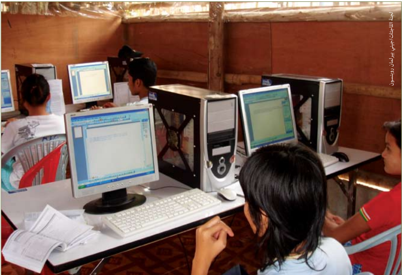
دورة كمبيوتر تنظمها منظمة زوا في مخيم ماي لا في ماي سوت في تايلاندا. أيار/مايو ٢٠٠٨.

إذا كان على الشباب في بيئات النزوح المطول كسب الدخل من أجل أسرهم ودعم التنمية المجتمعية والمساهمة في