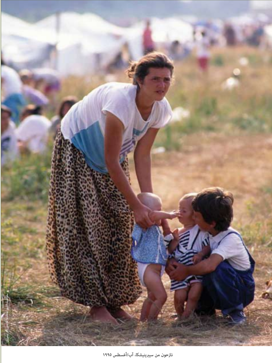
نازحون من سيرينيشكا، آب/أغسطس ١٩٩٥

مناصرة وتعبئة ودعم الاستجابات الوطنية والدولية الشاملة المطلوبة. ولكن ما يعنيه ذلك أن المفوضية عليها أن تدافع عن النازحين حتى في حالة عدم وجودهم على سلم الأولويات السياسية وأن تقف إلى جانبهم حتى يجدون حلاً لأزمته. وتقع على عاتق السلطات الوطنية المسؤولة الأساسية في خلق ظروف تمكن النازحين من إيجاد حلول دائمة. ويمكن أن تكون جهود المناصرة المستمرة التي تبذلها المفوضية مع هذه السلطات، مقترنة بالمساعدة الفنية التي تقدمها لهم مثلاً في تطوير استراتيجيات شاملة لحل مشكلة النزوح، عاملاً مساعداً في تحقيق هذه الغاية.