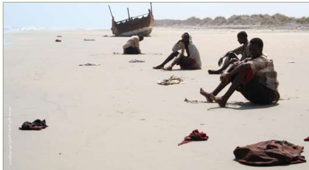
ناجون منهجون على شاطئ اليمن في انتظار المساعدة إثر عبور خليج عدن في عملية نقل نظماً.

يُعتبر اللجوء والهجرة في الوقت الراهن مجالان منفصلان من مجالات السياسة؛ حيث يعتبر اللاجئون على أنهم يفتقرون للقدرة والإمكانات، مجرد متلقين لا فاعلين أرغموا على النزوح وفي حاجة ماسة للحماية؛ في حين يعتبر المهاجرون على أنهم هاجروا