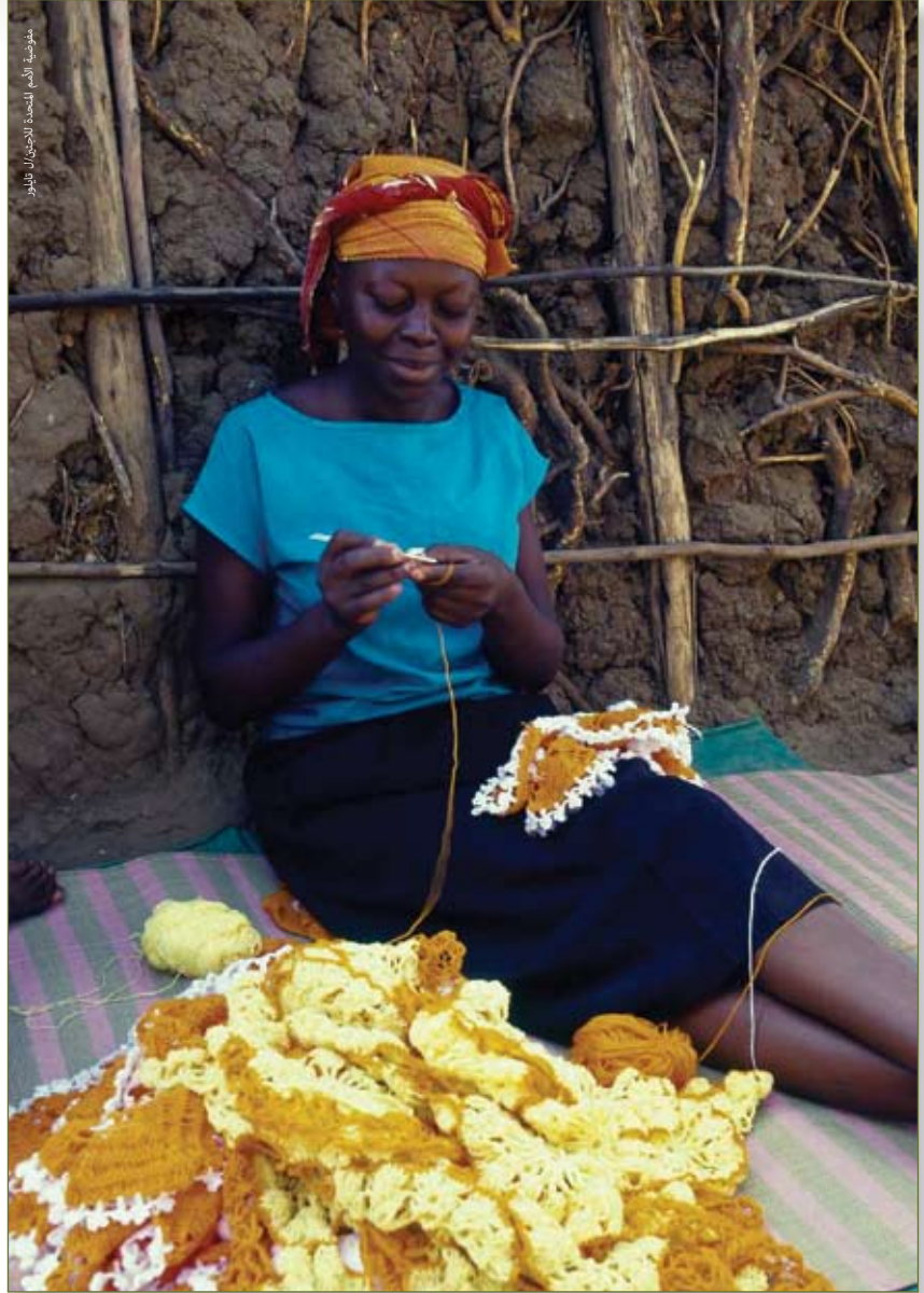
عضوة في مجموعة النساء للحياكة في مخيم كاكوما

أبيبي فييسا ديمو أعيد توطينه مؤخراً في أستراليا. ويود الكاتب الإعراب عن تقديره للمساعدة التي قدمتها ربييكا هورن (RHorn@qmu.ac.uk)، الزميلة الباحثة في المعهد الدولي للصحة والتنمية، جامعة الملكة مارجريت في إدنبرة، في كتابة هذه المقالة.