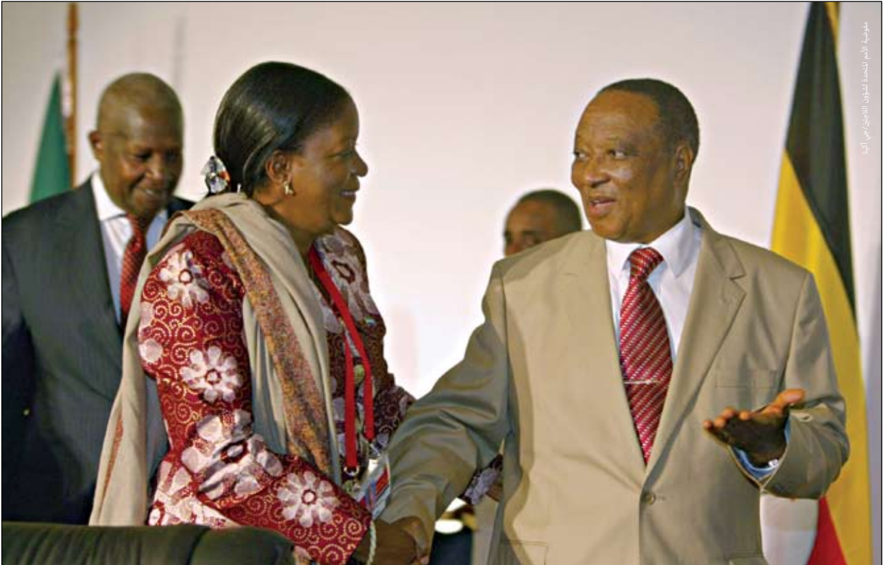
رئيس وزراء أوغندا، أبولو نسيبامي، (على اليمين) مع وزيرة خارجية سيراليون، زينب بانغورا، عقب افتتاح الجلسة غير العادية للمجلس التنفيذي للاتحاد الأفريقي في كامبالا خلال انعقاد قمة الاتحاد الأفريقي في كامبالا، أوغندا، ١٩ أكتوبر ٢٠٠٩.

ومع تنفيذ هذه العملية، أقرّ الاتحاد الأفريقي بالحاجة لوجود إطار عمل قانوني شامل للقارة عن النازحين