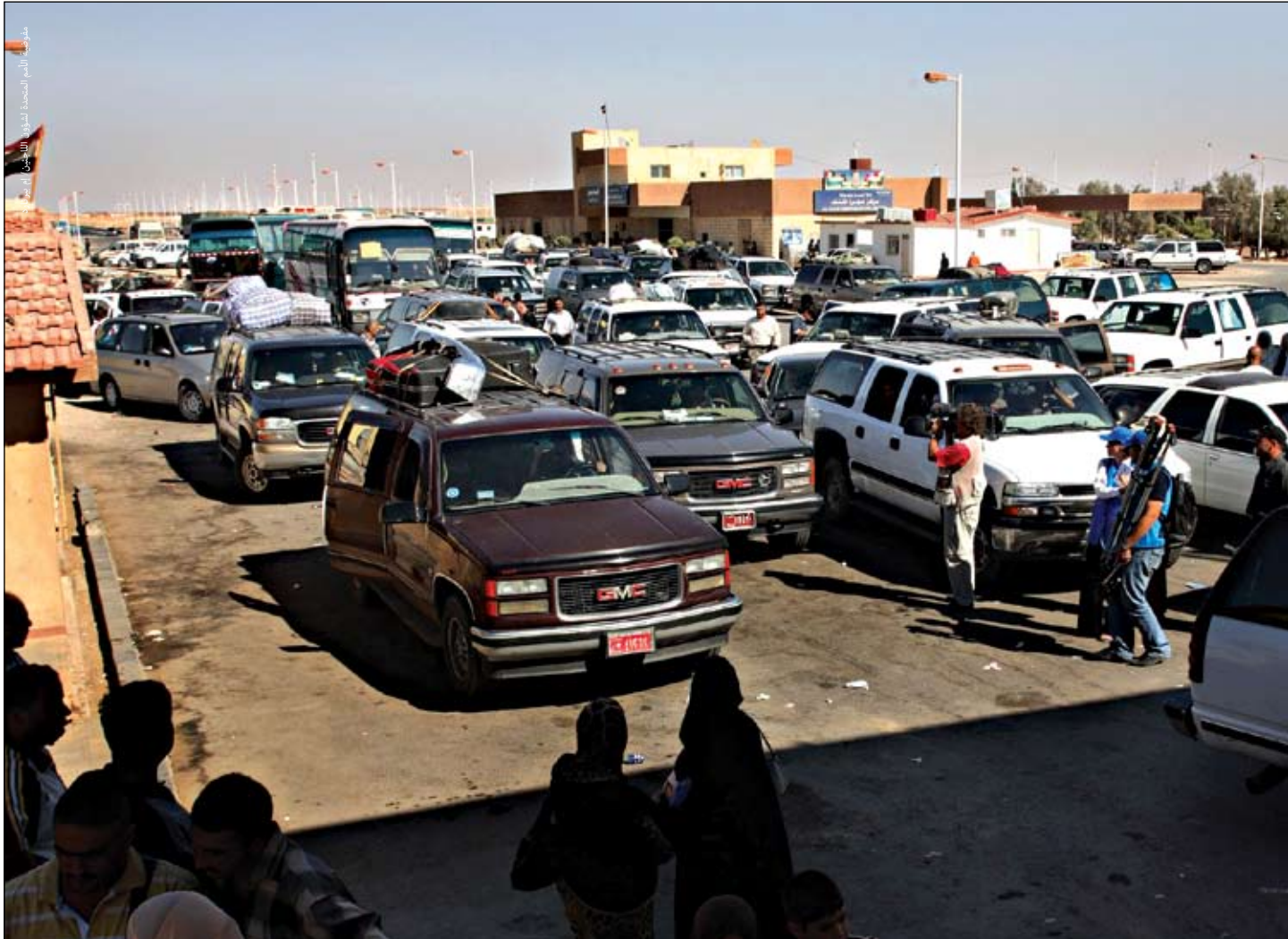
اللاجئون يصلون إلى حدود مخيم التنف خلال عبورهم بين سوريا والعراق.

هناك بُعد هام آخر يمثل تحدياً ينبغي احتسابه، إذ ليس التنقل "عبر الحدود" هو عبور حدود الدولة الأم لمرة واحدة بغرض الهرب من الاضطهاد أو الصراعات ولكنها إمكانية التردد بين دولة اللجوء والموطن. وتتأتى