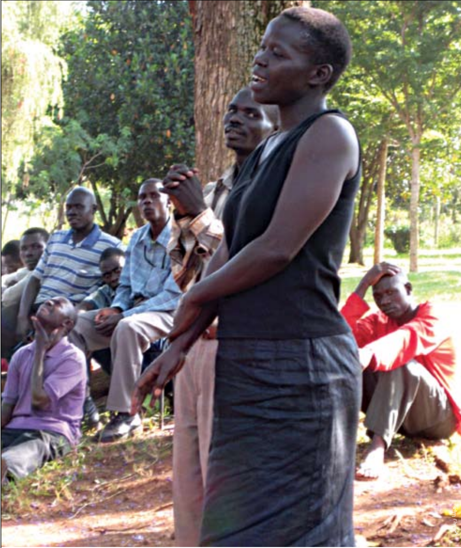
مقابلة للنازحين داخلياً في جينجا في أوغندا. لقد عملوا على تنظيم أنفسهم خلال العامين الماضيين (جنباً إلى جنب مع النازحين داخلياً في كمبالا وعنتيبي وماسيندي) ويطالبون بإدراجهم في إطار العودة وإعادة التوطين والأنشطة التي وضعتها الحكومة وشركائها.

وتبدو الكثير من الأساليب والأدوات الحديثة الموضوعية بهدف تحديد النازحين في الحضر أنها تركز حصرياً على كيفية تحديد ما إذا كانت أوضاع النازحين أكثر سوءاً من أوضاع السكان المحيطين. ويستقر الناس في المواقع الحضرية وفقاً لدخلهم، وهو ما يعكس تماماً الحالة الاجتماعية لجيرانهم من السكان. ومن ثم فإن النازحين داخلياً ينتهي بهم المآل غالباً إلى العيش وسط أكثر السكان فقراً في المدن. ويستحق الأمر منا هنا أن نتساءل عما إذا كان من الممكن أن نعتبر وجود النازحين ضمن أكثر سكان المدينة فقراً بمثابة حل مستدام للنازحين.