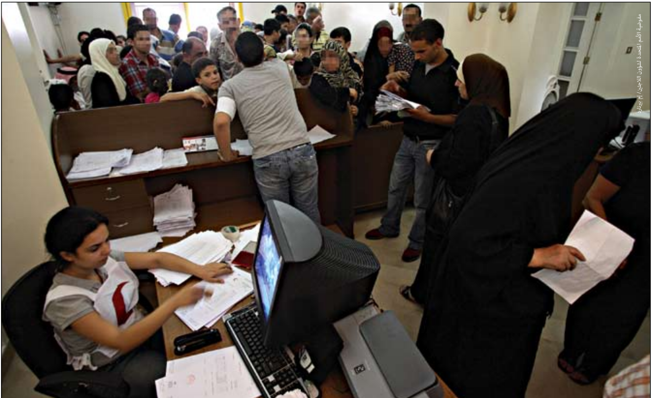
مفوضية الأمم المتحدة لشؤون اللاجئين تقوم بتسجيل عائلة عراقية مستضيفة وتستحق الحصول على أول المساعدات الغذائية الممنوحة في دمشق.

وقد سعت المفوضية كذلك لتعزيز إنشاء المراكز المجتمعية التي يستطيع فيها العراقيون وغيرهم من