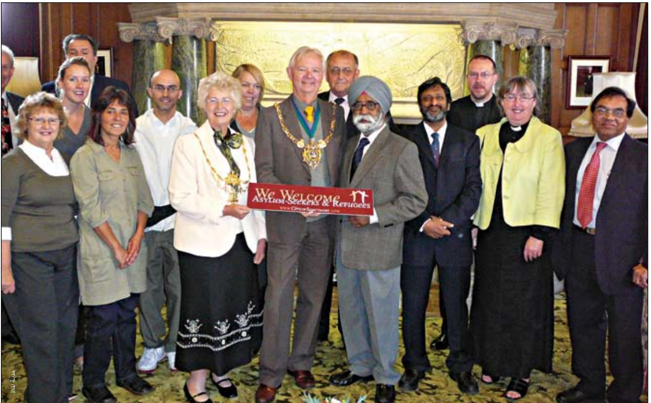
بدء عمل مجلس مدينة شيفلد، سبتمبر ٢٠٠٧.

وقد نشأت حركة (مدينة الملاذ) في شيفلد في شمال إنجلترا في عام ٢٠٠٥ وبدأت بقيام مجموعة من الأشخاص بتنظيم سلسلة من الاجتماعات المحلية الأهلية لكسب