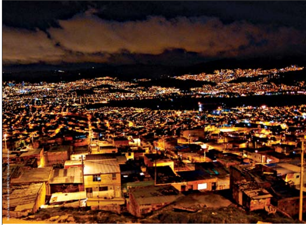
منظر ليلي لمدينة سويداد بوليفار في جنوب غرب بوغوتا، كولومبيا.

ويصل التعداد السكاني في بوغوتا إلى نحو سبعة ملايين نسمة، منهم أكبر تجمع من المهاجرين والنازحين داخلياً في البلاد - حيث تؤول ما يقرب من ٢٧٠ ألف نازح داخلي. وهاتان الظاهرتان تنتميَان لنفس المنشأ والسبب: