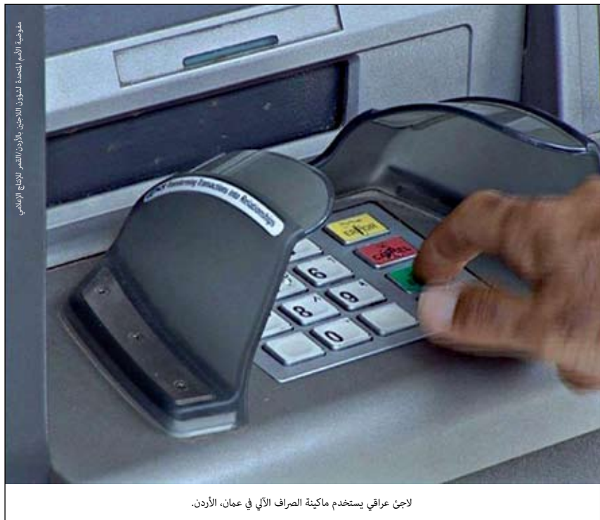
لاجئ عراقي يستخدم ماكينة الصراف الآلي في عمان، الأردن.