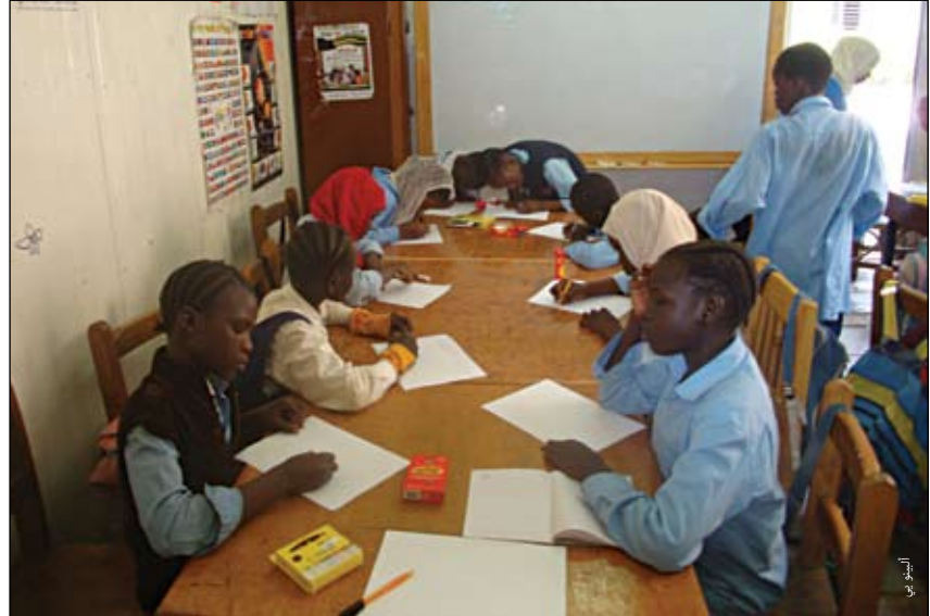
أطفال في "مدرسة للاجئين" تابعة لمركز خدمات القديس أندرو للاجئين بالقاهرة.

١. ورقة سياسية صادرة عن مفوضية الأمم المتحدة لشؤون اللاجئين بخصوص اللاجئين في الحضر (٩٧/٢٥/IOM - ٩٧/FOM٢٠) ونجد شرحاً وافياً لها في مستند سياسة مفوضية شؤون اللاجئين بخصوص اللاجئين في المناطق الحضرية (٩٧/FOM٩٥-٩٧/٩٠/IOM).