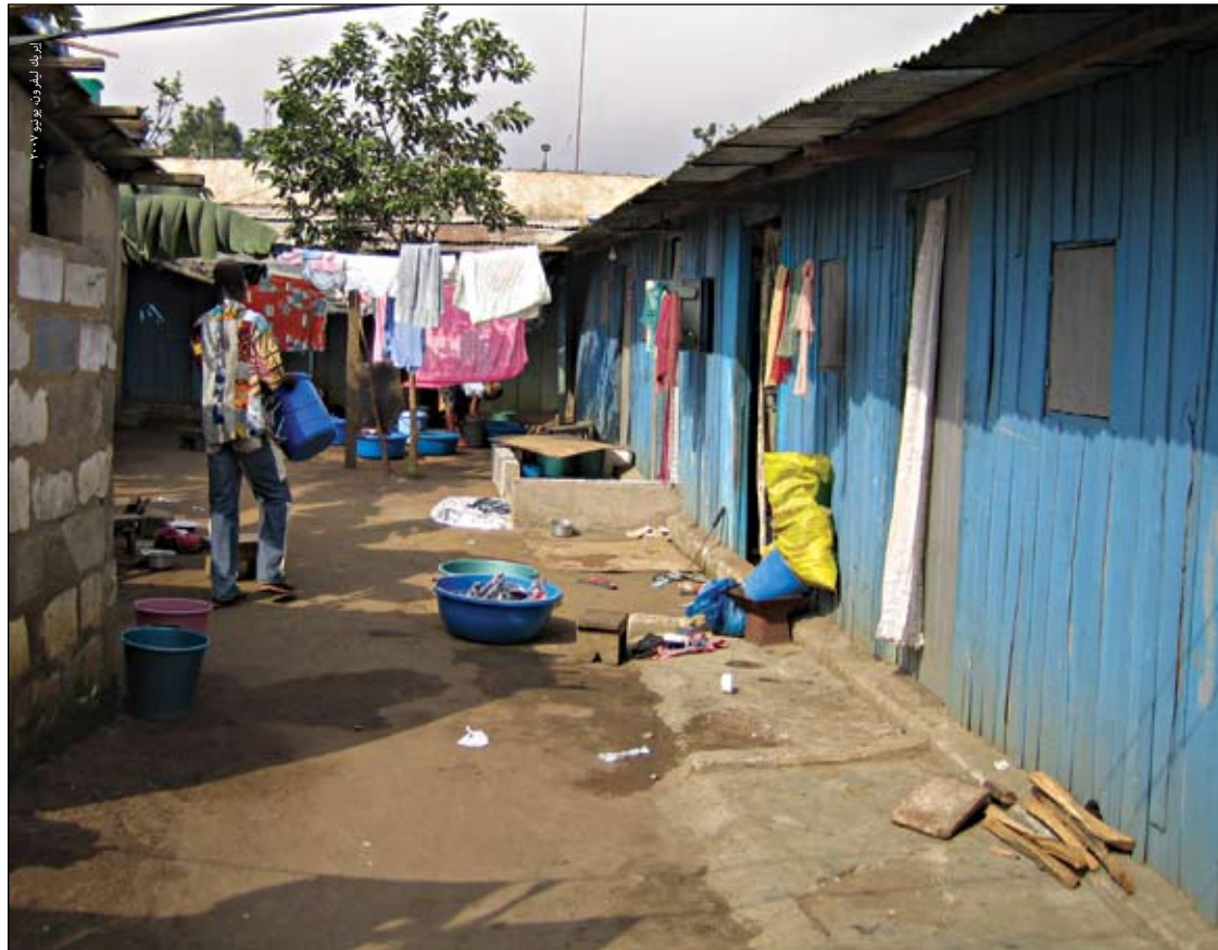
مجمع للنازحين داخلياً في حي أبوبو في أبيدجان.

وتشمل اهتمامات الحماية الأساسية للنازحين داخلياً مشاعر عدم الأمن والاضطرار لتغيير محل الإقامة عدة مرات داخل نفس المدينة بسبب عمليات الإخلاء أو للفرار من كشف أمرهم، والتعرض للترحيل القسري (الخرطوم) أو العجز أو عدم الرغبة في العودة إلى مساكن