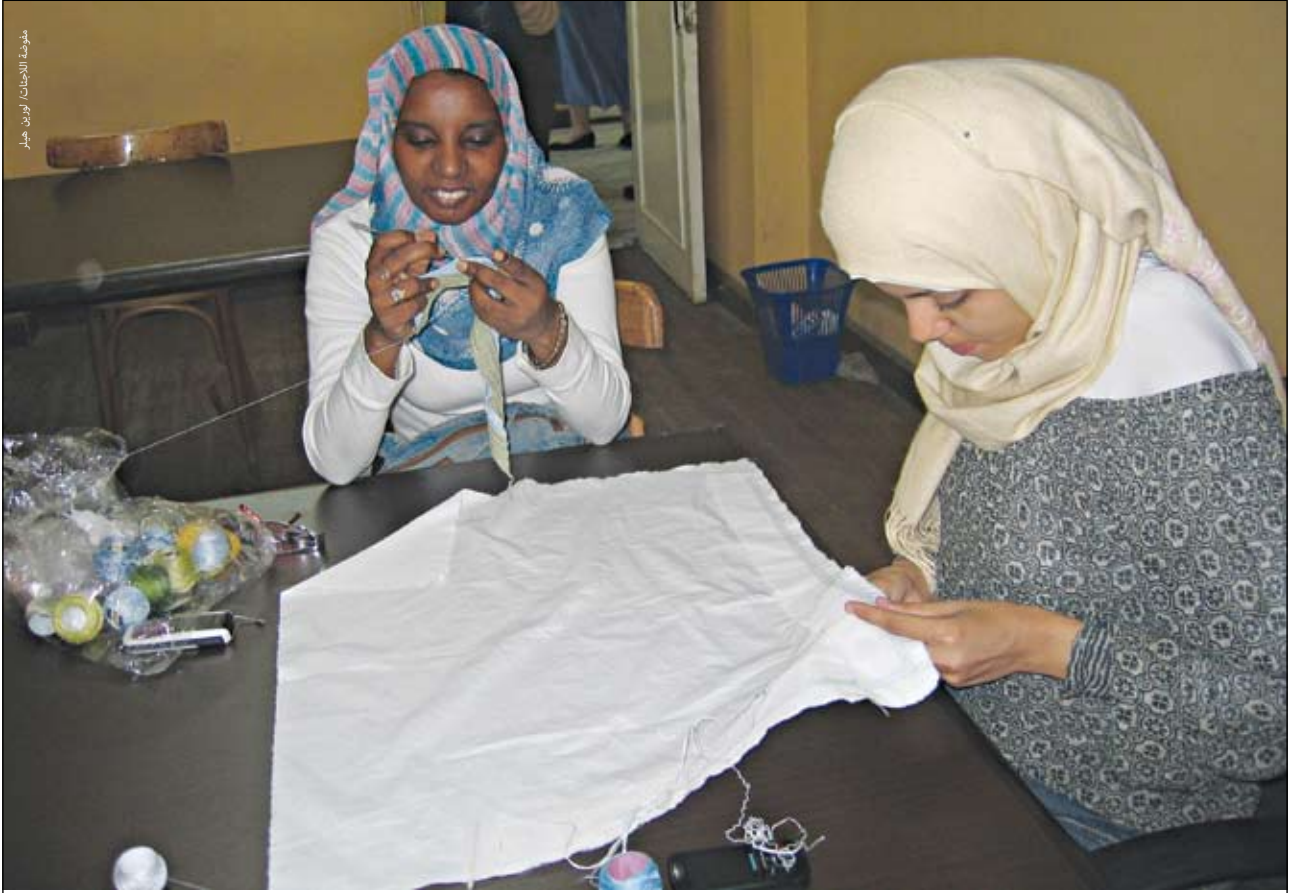
نساء من اللاجئين يعملن في مصنع ماليكا للملابس الكتانبة بالقاهرة.