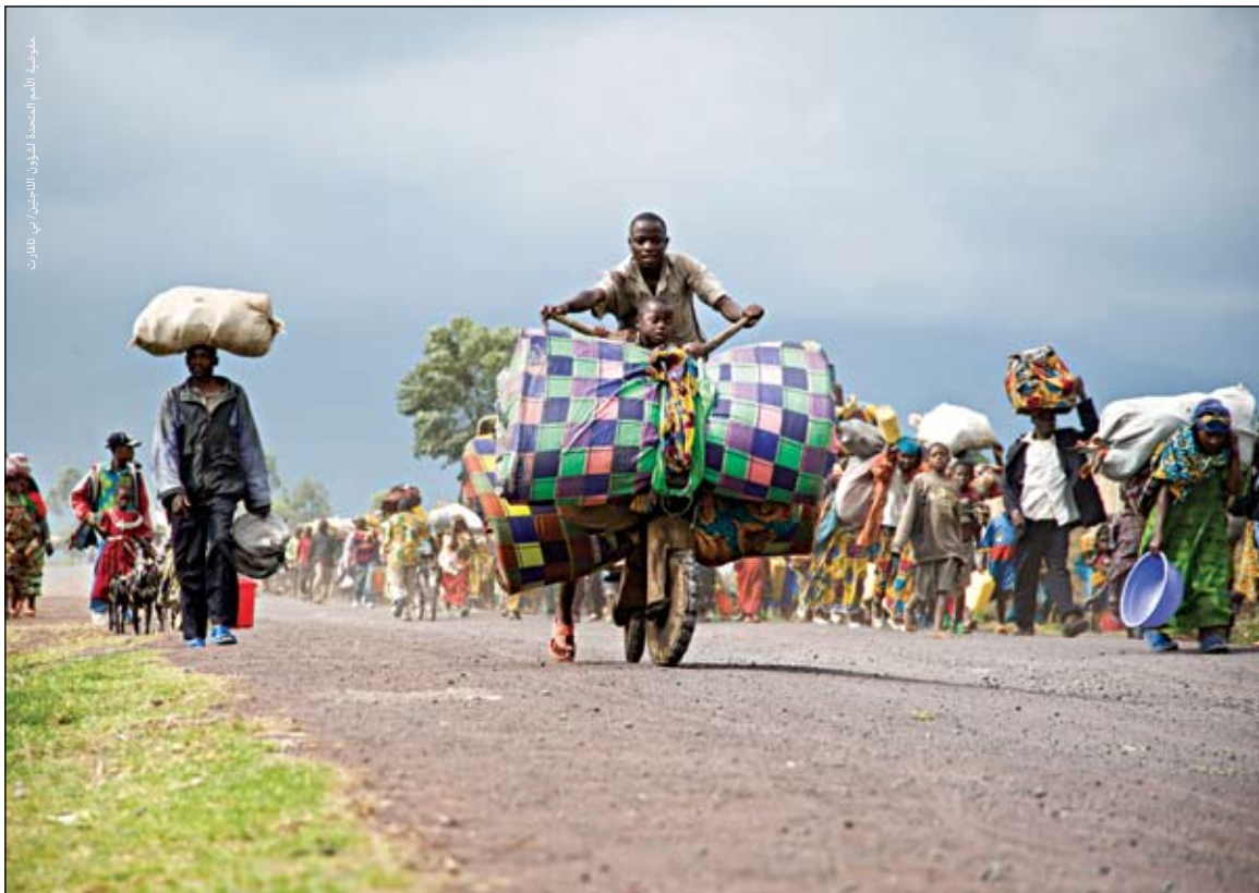
الآلاف يفرون من موقع للنازحين والمنطقة المحيطة به في كيباتي، شمال كينيو، جمهورية الكونغو الديمقراطية، نوفمبر ٢٠٠٨.

وقد أوضح زاكاري لومو عند حديثه عن المؤتمر الدولي لمنطقة البحيرات العظمى أن المشكلة الأساسية التي تواجه النازحين داخلياً ليست غياب القوانين ولكن بالأحرى "غياب الأنظمة القومية القوية والالتزام المحلي والدولي بفرض المعايير الدولية القائمة"٥. وتعكس صياغة المعايير الدولية والإقليمية لحماية ومساعدة النازحين داخلياً النوايا الحسنة للأفراد والجماعات والدول الساعية لتخفيف المعاناة الإنسانية ولزيادة ثقافة حقوق الإنسان. وغالباً ما تظهر الحتميات أو الفشل السياسي هذه النوايا نتيجة لعدم وجود استراتيجية فعالة للتعاون مع القوى الكائنة.