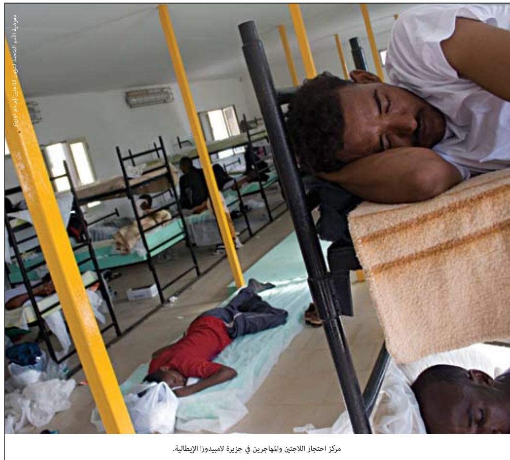
مركز احتجاز اللاجئين والمهاجرين في جزيرة لامبيدوزا الإيطالية.

ولكن، خلافاً لما كان عليه الوضع في العالم عام ١٩٥٦، تتزايد المضاعف اليوم في التمييز بين المهاجرين النظاميين وغير النظاميين، فبواعث الهجرة متعددة تختلف بحسب