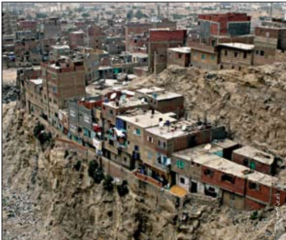
منشية ناصر - مستوطنة غير رسمية تقع على مشارف القاهرة في مصر وتعد من أكثر المناطق كثافة سكانياً في إفريقيا.

وأيضاً كانت طبيعة المدينة، ستبقى آليات الهجرة من الريف إلى الحضر تشكل تحديات خاصة عندما تتم الهجرة دون رضى المقيمين في الحضر. وتمثل آليات الهجرة المذكورة أيضاً تحديات كبيرة أمام الراغبين في تقديم المساعدة، لعدة أسباب منها على وجه الخصوص أن الكثير من خبرات المجتمع الدولي قد سبق أن تركزت على أماكن أخرى، ما يدعو إلى ضرورة تكيف أو حتى تحويل عمليات وأساليب العمل الإنساني لتمكين