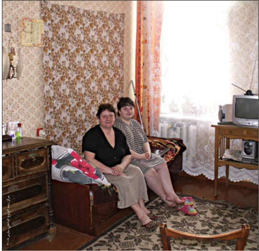
أسرة من النازحين داخليًا من الشيشان قد رفعت دعوة في المحكمة الأوروبية لحقوق الإنسان ضد إجلائهم من شقتهم الخاصة باستافروبول في روسيا.

في ضوء التعريف الوارد في المبادئ التوجيهية بشأن النزوح الداخلي ولكن أيضًا حتى يكون لدينا نهج مشترك بين جميع العوامل المؤثرة فيمن يتم إدراجه في الفرز النهائي.