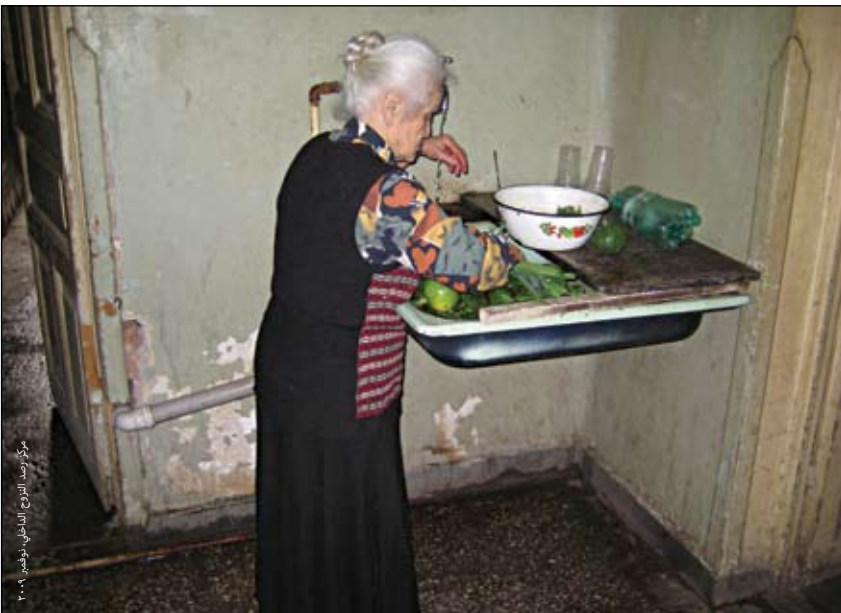
امرأة من النازحين داخليًا تعد وجبة في مركز جماعي كان في السابق مركزًا لمعالجة مرض السل في تيليسي في جورجيا.