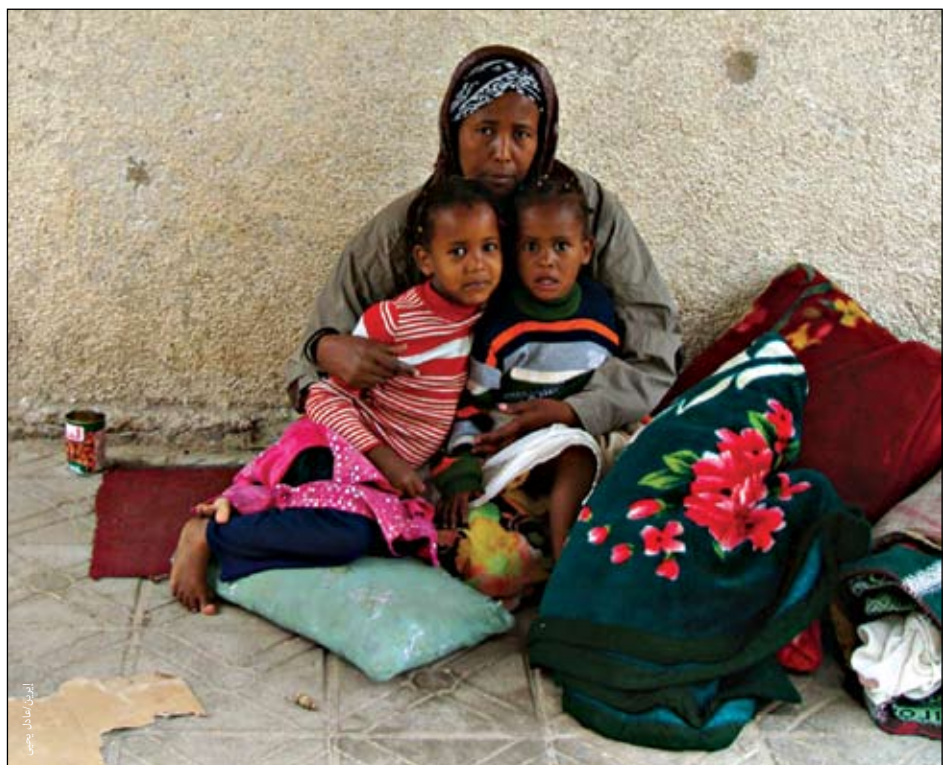
لاجئون صوماليون في اليمن.

ولا يفتأ الشعب اليمني بصفة عامة يعبر عن اعتزازه وفخره بأن اليمن تستقبل اللاجئين الصوماليين في الوقت الذي تفلظهم فيه جيرانها العرب الأكثر ثراء. ويرى