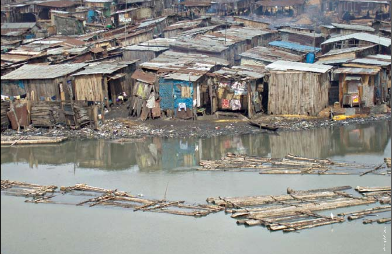
مسكن بأحد أحياء الفقراء في حي إيبوتي ميتا في لاغوس، نيجيريا.

وعلى الرغم من أن لا مكان حصين ضد الكوارث الحضرية والأزمات الإنسانية فإن المدن في العالم النامي هي الأكثر عرضة لتوابع هذه الكوارث عما هو الحال في العالم المتقدم، وتستمر مخاطر الكوارث في الزيادة نتيجة للحضنة السريعة وقد ساعد سوء إدارة أو السيطرة على الحضنة والإدارة غير الدقيقة في الأزمات الإنسانية بل وتسبب فيها.