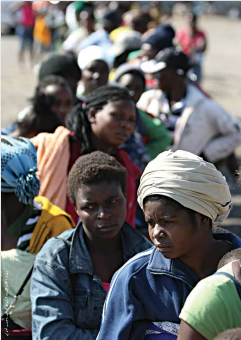
نساء من زيمبابوي يصففن في طابور خارج مركز موسينا لاستقبال اللاجئين والذي تديره وزارة الشؤون الداخلية بدولة جنوب أفريقيا.

ولا يمكن عزل أزمة اللاجئين وغيرهم من الأشخاص المعننين في المناطق الحضرية بل هي تحتاج المعالجة في سياق أوسع يشمل الفقراء في تلك المناطق، ويحتاج المجتمع الإنساني لإعادة تقييم نموذج المساعدة في المناطق الحضرية وأن تحدد الجهات الإنسانية كيفية دعم المبادرات المجتمعية والتعاقدية بصورة أفضل.