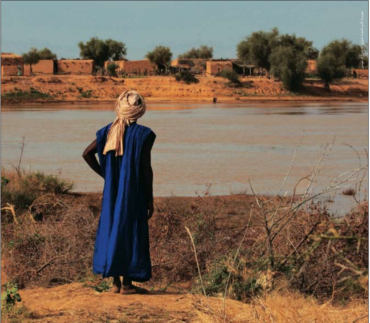
لاجئ موريتاني ينظر إلى قريته حيث موطنه الأصلي عبر ضفة النهر السنغالي. أكتوبر ٢٠٠٥.

في عام ١٩٨٩ انطلقت شرارة أحداث العنف بين موريتانيا والسنغال (التي عرفت محلياً باسم «الأحداث») نتيجة النزاع على حقوق الرعي في وادي نهر السنغال الواقع على الحدود بين الدولتين. وتأثر بالأحداث الموريتانيون المقيمون في السنغال، فتعرضت محلاتهم التجارية للنهب والسلب كما تعرض معظمهم للطرد من السنغال إلى بلادهم. واستمرت الأعمال الانتقامية مدة شهر كامل بعد اندلاع الأحداث ضد كل من الموريتانيين السود في وادي نهر السنغال والمغاربة البيض. ويقطن