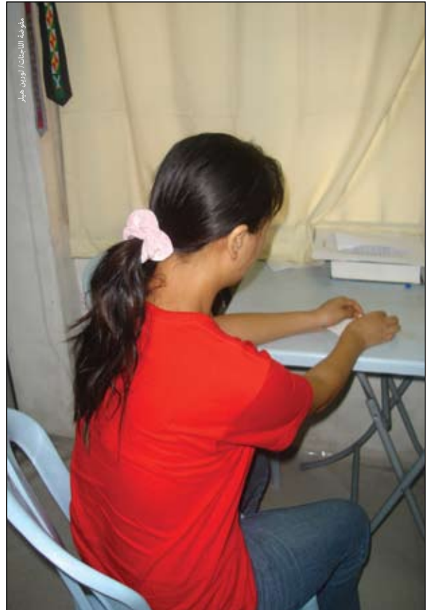
إحدى اللاجئات البورميات في ماليزيا التي تعرضت للتحرش الجنسي في العمل وتركت عملها وهي الآن لا تبحث عن عمل آخر خوفاً من التعرض ثانية للتحرش الجنسي وأو إلقاء القبض عليها.

تستضيف القاهرة مجموعة متنوعة للغاية من اللاجئ تناضل من أجل البقاء في بيئة حضرية صعبة جداً مع