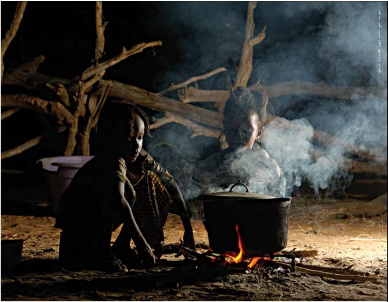
مطوية الأمم المتحدة لشؤون اللاجئين/الفرنسيين

هؤلاء الأطفال من اللاجئين لا يعرفون أي موطن آخر سوى السنغال. أكتوبر ٢٠٠٥.