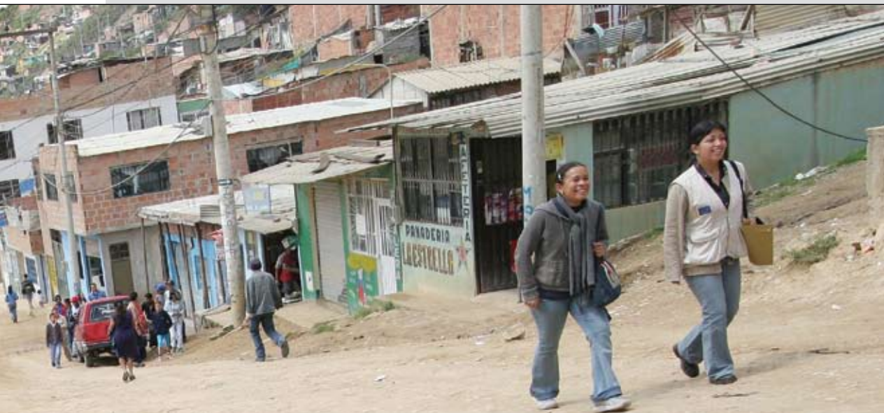
لوس أتوس دي كازوكا، مدينة الأكواخ سيوداد بوليفار، بوغوتا. جماعات مسلحة تجوب الشوارع خلال الليل.

وفي حين لم يكن مثل هؤلاء الناس مضطرين على الانتقال إلى مسافات بعيدة، إلا أن خسارتهم لممتلكاتهم ولحقوقهم الإنسانية كانت كبيرة للغاية، ففي إحدى الحالات، لجأ الناس إلى مدرسة محلية لم تكن مناسبة للعيش فيها. ولم تلق استغاثاتهم اهتماماً من الحكومة التي رفضت تقديم المساعدة لهم على أساس أنهم لم يستوفوا