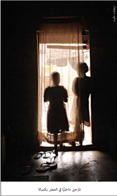
نازحين داخلياً في الحضر بكمبالا

إذا كانت لدى السلطات الحكومية الرغبة الحقيقية في وضع حلول مستدامة للنازحين إلى الحضر، فإن مخاوف وتطلعات هؤلاء الأكثر تأثراً بالنزوح الحضري ينبغي أن تؤخذ في الحسبان.