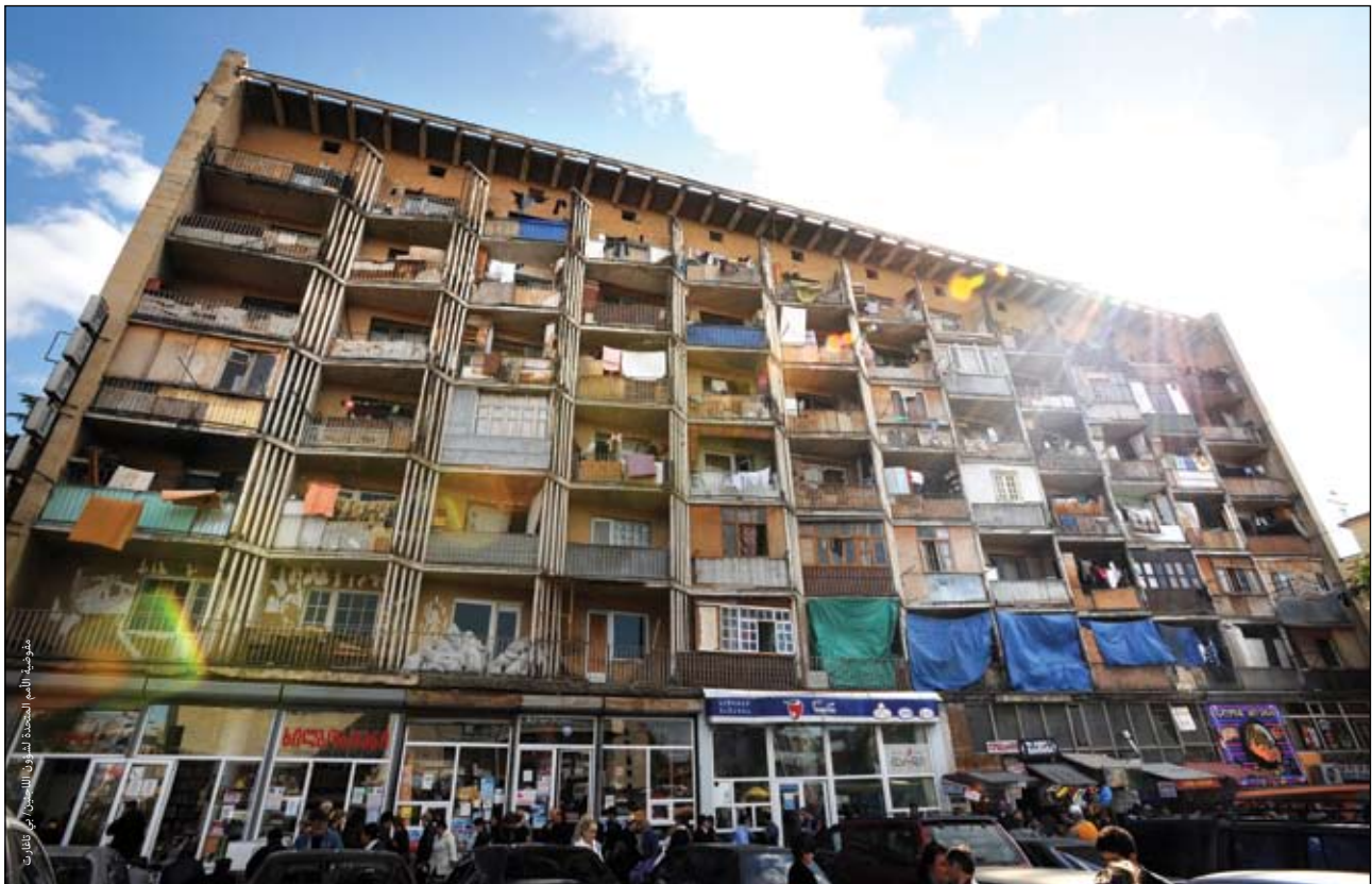
مركز جماعي للنازحين داخلياً في مبنى كان مستشفى في السابق، تبليسي، جورجيا. تعيش نحو ١٤٨ أسرة في هذا المجمع الذي يعاني من انتشار الفئران والحشرات به كما أنه آيل للسقوط.

وسياسة مفوضية الأمم المتحدة لشؤون اللاجئين الأخيرة الخاصة بحماية اللاجئين وتوفير الحلول لهم في المناطق الحضرية تلاحظ أن غياب الدعم الاجتماعي يحد من فرص الاعتماد على النفس بين تجمعات اللاجئين. وإن كانت هذه هي المرة الوحيدة التي يُذكر فيها الدعم الاجتماعي في هذه الوثيقة. فيجب إعطاء المزيد من