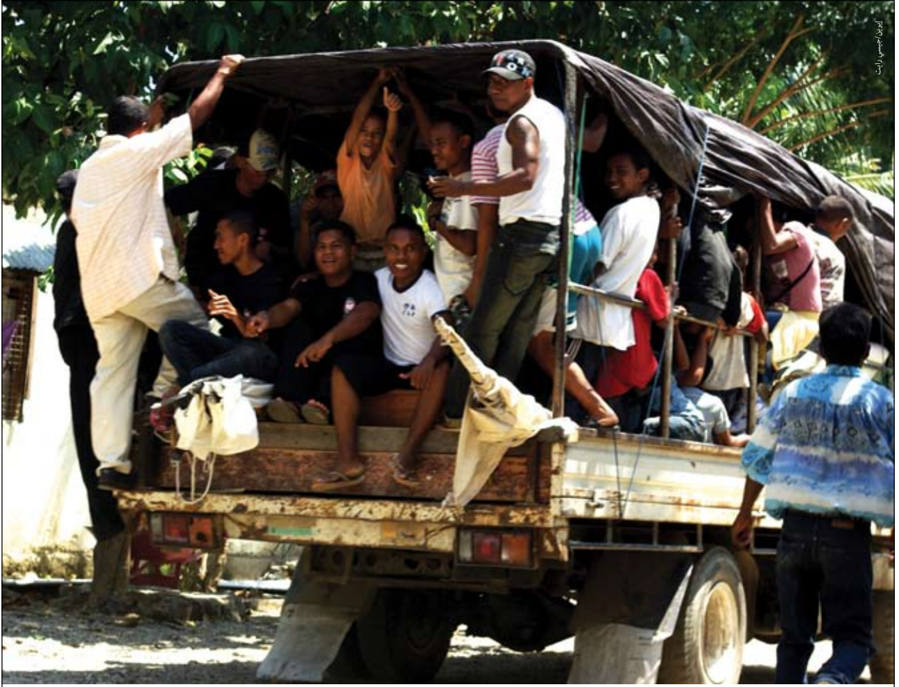
العائدون يغادرون مخيم النازحين في ديلي.

هذا الموقف الذي يأتي على رأس الشكوك الأخرى لخلق مخيمات النازحين داخلياً يزيد من أحاسيس الإحباط والضعف لدى الرجال النازحين داخلياً وقد غدت ثقافة الاعتمادية في حياة المخيمات التأثير المدمر لعدم الثقة الجسسانية الأسرية التي بقيت غير محسومة، وكثيراً ما يصاحب هذا الاستياء أفراد الأسرة عندما إعادة توطينهم. وبصورة عامة، لم تلق النساء حزم مساعدات العودة لاستعمالها في سداد الديون أو مساعدتهن وأطفالهن في إعادة التوطين بعد ترك المخيمات.