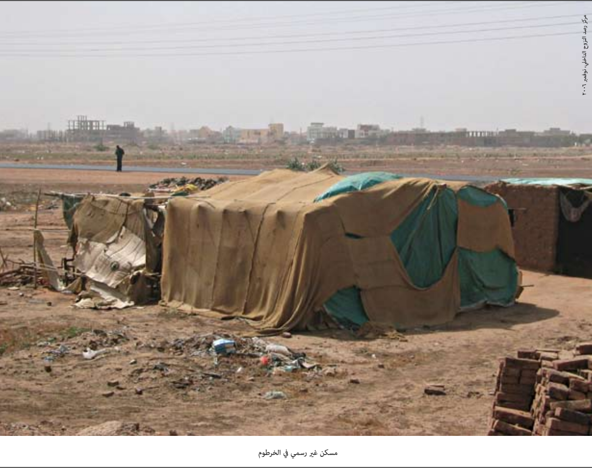
مسكن غير رسمي في الخرطوم