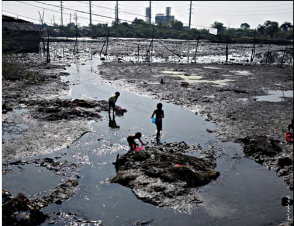
منطقة باكور كافيت جنوب مانابا، الفلبين.

قد يكون التحدي الأكبر أمام الجهات الإنسانية - وربما الفرصة الكبرى أيضًا - هو تطوير طرق العمل مع الإطار المؤسسي الحالي للمنظمات البلدية ومؤسسات المجتمع المدني الموجودة بمعظم بلدات ومدن العالم النامي، ويُعد التعاون بين الوكالات أساسًا للعمليات الإنسانية الناجحة في المناطق الحضرية. إن نطاق الأطراف المعنية أهميته وهو الذي يشمل الحكومات المحلية ووكالات توفير الخدمات وإدارات الحكومات الوطنية والإدارية ومجالس المدينة والإدارات الفنية والجماعات الدينية والمنظمات المجتمعية وقوات الشرطة والأوساط الأكاديمية.