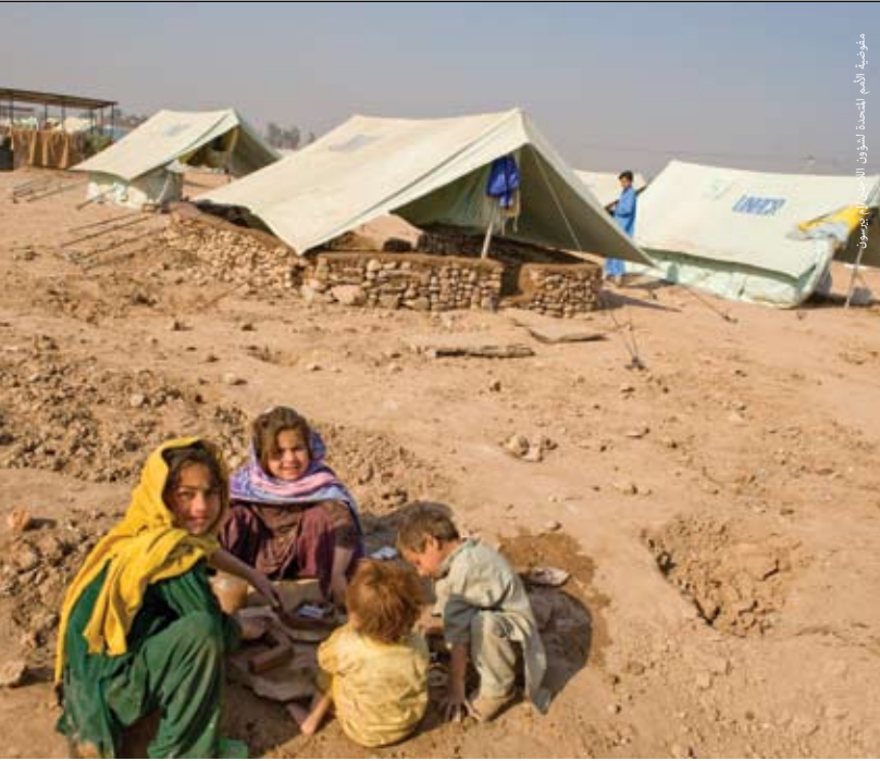
أطفال من النازحين يلعبون في مخيم كاشا غاري، بيشاور، مقاطعة الحدود الشمالية الغربية، ديسمبر ٢٠٠٨.

■ الحفاظ على مسافة ملائمة عن المجتمع المحلي لأنها تسمح في دفع المجتمع المحلي لاستخدام وتبني الأفكار الجديدة المناسبة لوضعهم الجديد. ودون وجود هذه المسافة الكافية بين المجتمع المحلي والكاادر العامل على تقديم الخدمات في المخيمات لن يتقبل المجتمع المحلي الأفكار الجديدة ولا المعلومات المتشرك بها ولا نشرها من قبل الكادر.