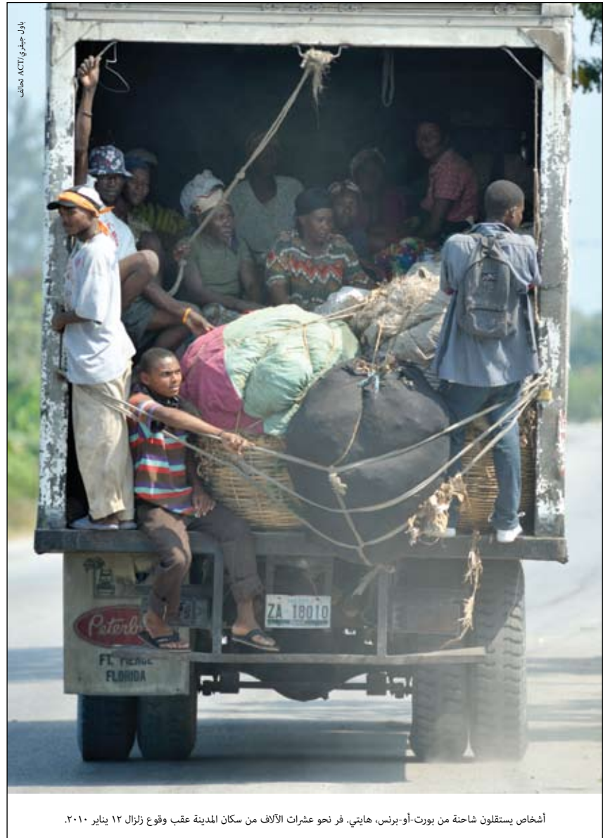
أشخاص يستقلون شاحنة من بورت-أو-برنس، هايتي. فر نحو عشرات الآلاف من سكان المدينة عقب وقوع زلزال ١٢ يناير ٢٠١٠.

لا تزال الاستعدادات جارية مع طباعة هذا العدد من نشرة الهجرة القسرية لبدء الاستجابة الإنسانية لتأثيرات الزلزال في هايتي في ١٢ يناير ٢٠١٠. ويتجه النقاش كما ينبغي حتى في هذه المرحلة المبكرة على مرحلة ما بعد الاستجابة مؤكداً الحاجة للتعافي طويل الأجل إلى جانب الاستجابة. وبالمقارنة مع ما كان الأمر عليه من عشر أو خمسة عشر سنة، فقد تعلمنا أن كل مرحلة أو فترة