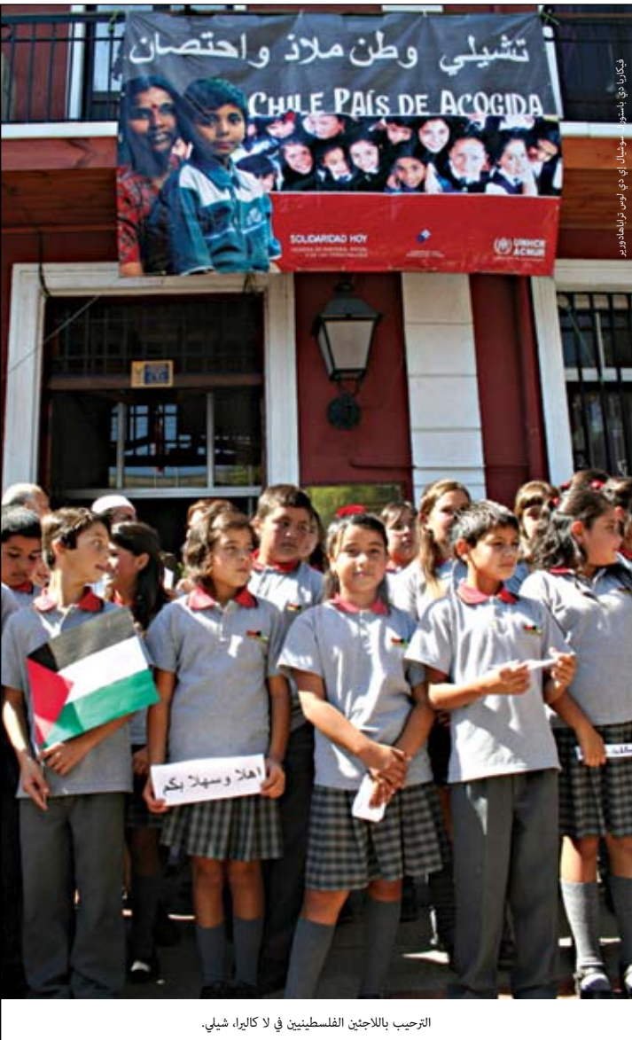
الترحيب باللاجئين الفلسطينيين في لا كايلا، شيلي.

تشير الاتفاقات المبرمة مع المجالس المحلية صراحة إلى خطة عمل المكسيك وبرنامج مدن التضامن. تمنح خطة عمل المكسيك، الموقعة من قبل ٢٠ دولة في أمريكا اللاتينية في سنة ٢٠٠٤، الحكومات ومنظمات المجتمع المدني في القارة إطاراً استراتيجياً وتشغيلياً أوضح «التحديات الأساسية لحماية اللاجئين وغيرهم من الأشخاص في أمريكا اللاتينية الذين يحتاجون اليوم إلى الحماية الدولية» وحدد