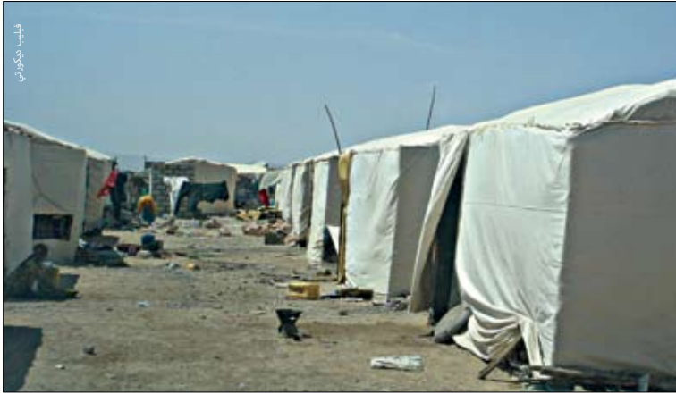
استيطان النازحين داخلياً عقب نشوب حريق، بوساسو.