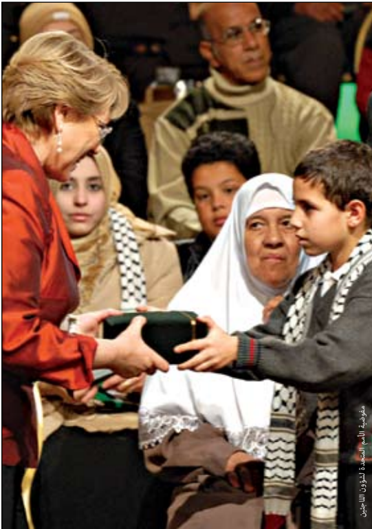
باشيليت، الرئيسة الشيلية السابقة ترحب بفتى ممثل عن اللاجئين الفلسطينيين عند وصولهم إلى شيلي في حفل أقيم في المقر الرئاسي لامونيدا

مع ذلك، فقد كان لمسألة «التضامن» دوراً رئيسياً في الالتزامات التي أخذتها الإدارات العامة المحلية على عاتقها، سواء على المستوى الشخصي أو المؤسسي. فم منذ أصبحت أمريكا اللاتينية مجتمعاً من الدول المستقلة، فتحت شعوبها أبوابها لجيرانهم المضطهدين الفارين من بلادهم لعدد لا يحصى من المرات. وكما ورد في مقدمة