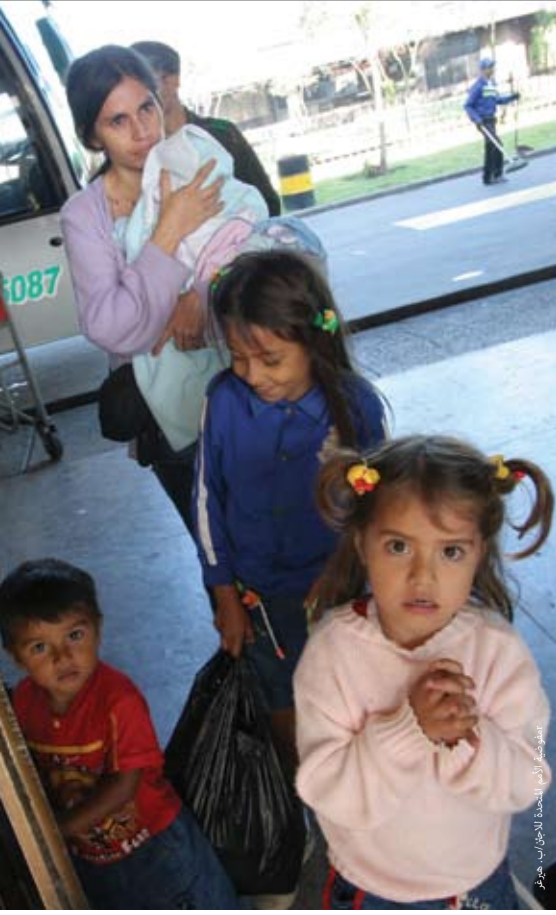
نازحون داخليا كولمبيون يصلون إلى المدينة

الواقع الحضري الجديد المفروض على النازحين الكولومبيين يعني لهم مشكلات يومية تبح ث عن حلول.