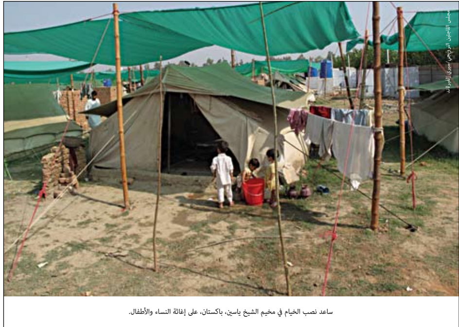
ساعد نصب الخيام في مخيم الشيخ ياسين، باكستان، على إغاثة النساء والأطفال.

تحت قيظ الصيف في باكستان ودرجة حرارة عامة تزيد على ٤٠ مئوية، يقبع في الخيم وفي درجة حرارة ٥٠ مئوية عشرات الألوف من الأشخاص الذين نزحوا عن ديارهم عام ٢٠٠٩ جزءاً من النزاع الدائر في الإقليم الحدودي الشمالي الغربي للبلاد وإقليم سوات. وقد استجاب مجلس اللاجئين النرويجي مباشرة لأزمة النازحين هناك، فصمّم هيكلاً لشبكات الظل المبتكرة لتثبيتها على الخيام. وبالتعاون ما بين المفوضية العليا لشؤون اللاجئين ووحدة الاستجابة لحالات الطوارئ في