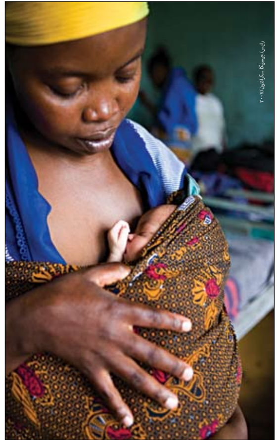
أم وطفلها من الكونغو الشرقية المتأثرة بالنزاعات.

لقد شهد العالم في جميع بقاعه تغيراً كبيراً في معدل وفيات الأمهات عند الولادة منذ عام ١٩٩٠. وترتفع تلك المعدلات بشكل خاص في البلدان المتأثرة بالنزاعات العنيفة، وهنا تبرز الأهمية القصوى للنفاذ إلى خدمات الصحة الإنجابية بما فيها التخطيط الأسري والعناية التوليدية الطارئة في الحد من معدلات