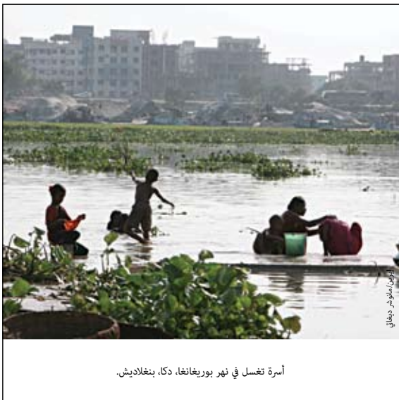
أسرة تغسل في نهر بوريفانغا، دكا، بنغلاديش.

يؤمن برنامج الأمم المتحدة للمستوطنات البشرية بشدة أن إقامة الشراكات مع الحكومات المحلية، والمنظمات غير الحكومية، والقطاع الخاص هي من العوامل الحاسمة التي تدفع المدن لتحمل تلبية حاجات كل من النازحين في الحضر والمجتمعات المضيئة لهم. ومن الضروري أيضاً على منظمات الأمم المتحدة، والحكومات الوطنية، والجهات المانحة جميعاً أن تستغل الفرص بتعزيز قدر أفضل من المشاركة والشراكات المثمرة لإيجاد الطرق الإبداعية نحو تحقيق الأعمال.