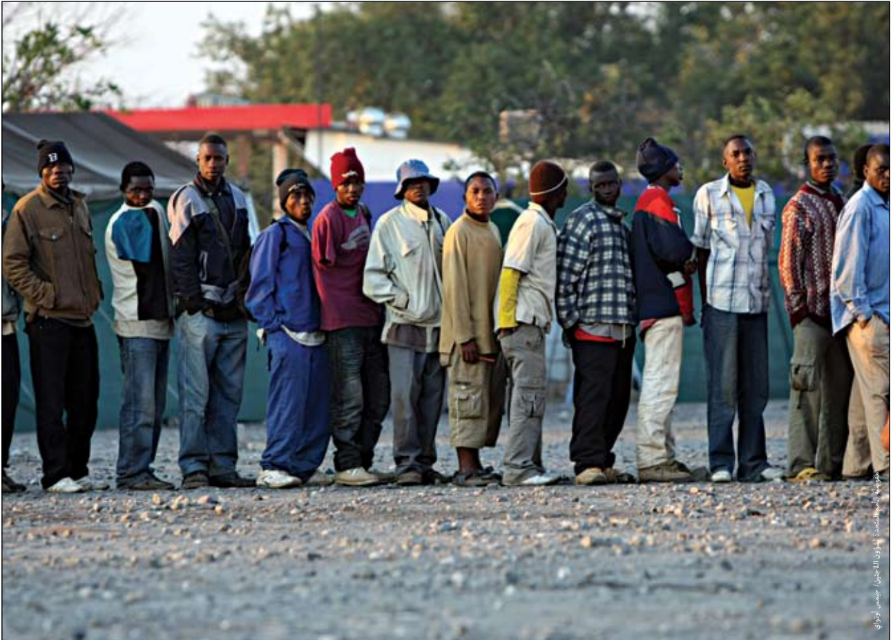
لاجئون من زيمبابوي يصطفون في الصباح المبكر في طابور خارج مركز موسينا لاستقبال اللاجئين، جنوب أفريقيا.

ولا يعد العنف الناجم عن رهاب الأجانب بالجديد على دولة جنوب إفريقيا في فترة ما بعد انتهاء