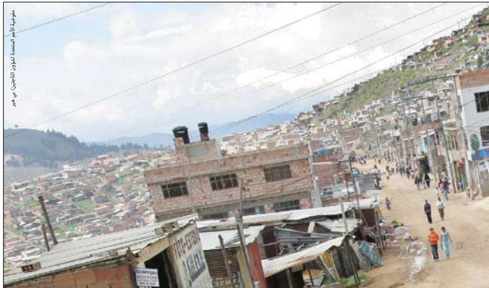
ملف ضمني: الأمم المتحدة لشؤون اللاجئين، بيرن