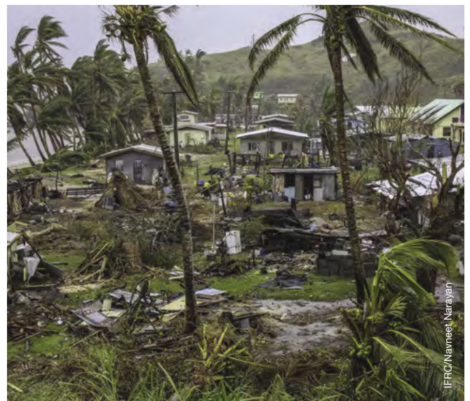
En 2016, el ciclón Winston dejó una estela de destrucción que afectó a unas 350 000 personas — más de un tercio de la población de Fiji.

Revista Migraciones Forzadas (RMF) proporciona un foro de intercambio de experiencias, información e ideas entre investigadores, refugiados y desplazados internos, así como las personas que trabajan con ellos. RMF se publica en español, inglés, árabe y francés por el Centro de Estudios sobre Refugiados.