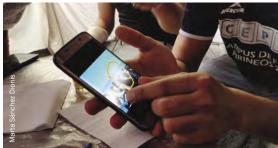
Uno de los participantes en nuestro estudio nos muestra la última foto que tiene de su hermano mayor desaparecido.

Emprender una búsqueda suele ser costoso y la falta de recursos financieros es una barrera más. Presentar denuncias, reunirse con las autoridades, viajar a los lugares donde se vio a una persona por última vez, o intentar seguir sus pasos puede conllevar importantes costes, por no hablar de las estafas o extorsiones a cambio de información. Además, en los países de tránsito y destino de migrantes, como España y el Reino Unido, muchas familias tienen empleos inestables y mal pagados y residen en viviendas precarias, lo que limita mucho su capacidad de iniciar una búsqueda. En los lugares de origen de los migrantes, como Etiopía, las familias suelen quedarse sin el apoyo económico que esperaban que les hubiera proporcionado su familiar desaparecido