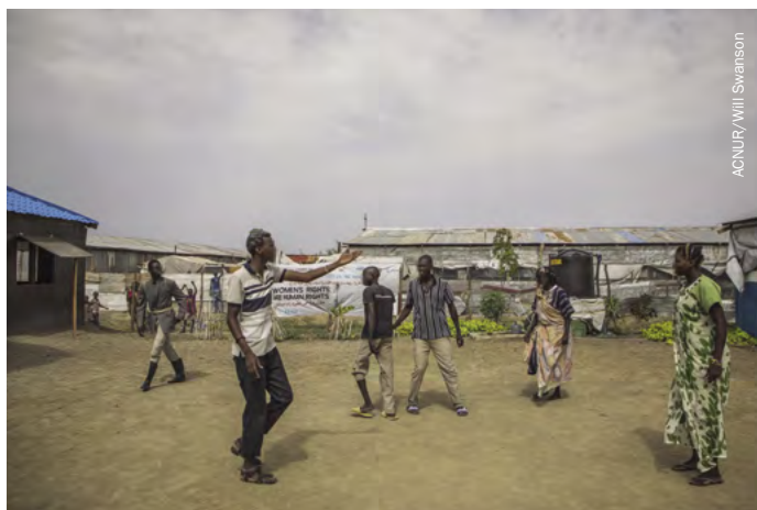
Desplazados internos sursudaneses en el centro de Protección de Civiles cerca de Malakal, en el Alto Nilo, representan una obra de teatro que aborda cuestiones como el suicidio y la desesperanza.

Uno de los cuatro principios de protección del Manual Esfera es “ayudar a las personas a recuperarse de los efectos físicos y psicológicos de la violencia real o la amenaza de violencia, la coerción o la privación deliberada” 7 . Por tanto, es fundamental que todos los actores humanitarios presten atención a las consecuencias psicológicas de las violaciones de los derechos humanos y al hecho de que los desplazamientos forzados afectan a las personas de manera diferente según su edad, género y diversidad. Sin un entorno de protección es imposible abordar