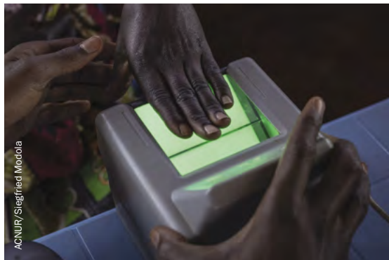
Un refugiado sursudanés es censado en el centro de tránsito de Aru, provincia de Ituri, República Democrática del Congo.

El potencial aumento de la eficiencia derivado del uso de la tecnología digital coincidió con un aumento del hincapié de los Estados donantes hacia la rentabilidad y la rendición de cuentas. Al mismo tiempo, el uso más generalizado de la tecnología de datos requiere una mayor inversión de capital y en equipos, personal y formación especializada. Un mayor volumen de datos disponibles también implica más esfuerzo en su procesamiento y comunicación. A falta de unos principios y procedimientos operativos estándar consensuados para la producción, recopilación y transmisión de datos, la preocupación por su calidad y seguridad ha aumentado.