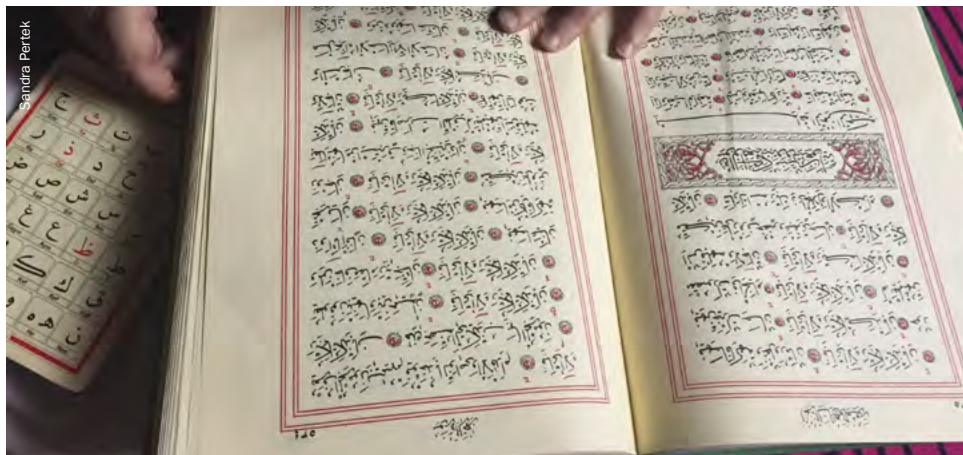
Una refugiada siria leyendo el Corán en su casa en Turquía.