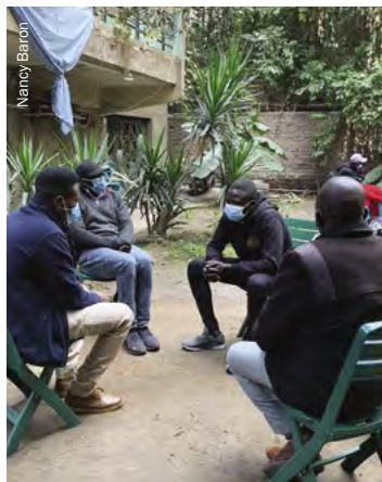
Formación de nuevos trabajadores de los PSTIC durante la pandemia de la COVID-19, El Cairo.

El apoyo social a través de la familia, los amigos o la comunidad es la piedra angular de cada plan de acción individualizado. Los trabajadores de los PSTIC ayudan a las personas a encontrar un sistema de apoyo seguro y a desarrollar las capacidades y la responsabilidad de dicho sistema. No se rechaza a nadie que