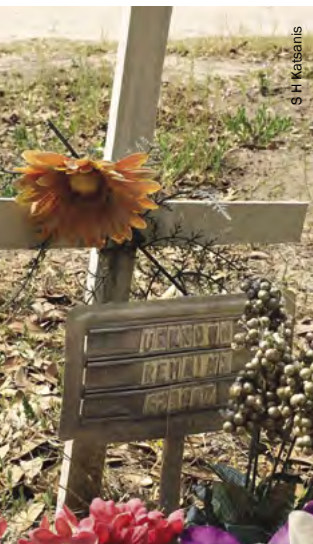
La tumba de un migrante desconocido en el cementerio del Sagrado Corazón, en el condado de Brooks.

Se están llevando a cabo cuantiosos esfuerzos gubernamentales y no gubernamentales para mejorar la búsqueda y recuperación, los procesos de identificación y de comunicación y repatriación. Por ejemplo, algunas jurisdicciones han empezado a enviar los restos humanos sin identificar y las muestras de ADN de “referencia familiar” a un laboratorio privado de ADN que no exige que las muestras se tomen en presencia de las fuerzas de seguridad, lo que ha contribuido a la identificación