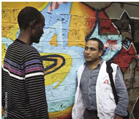
Un mediador cultural de MSF trabajando con personas desplazadas en Italia.

Algunos mediadores culturales asisten a los facultativos o al personal de los servicios de salud mental durante las consultas individuales, o trabajan con supervivientes de la tortura y mujeres víctimas de trata. Otros trabajan con entidades jurídicas o de seguridad, proporcionándoles información y servicios de traducción durante las vistas orales. Traducen tanto las palabras como los conceptos entre los clientes y los proveedores de servicios, garantizando que se entienda al cliente y que así pueda acceder a la atención y el apoyo que necesita.