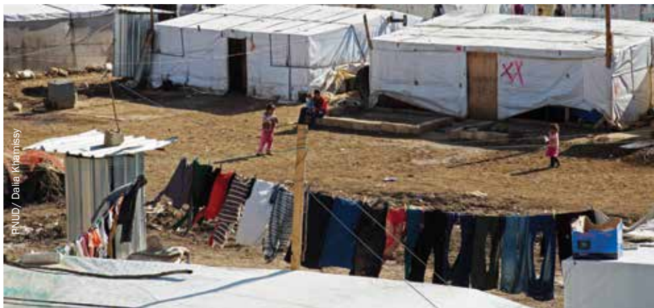
Asentamiento de tiendas de campaña de refugiados sirios en el pueblo de Gaza, Valle de la Becá, al este del Líbano, 2014.