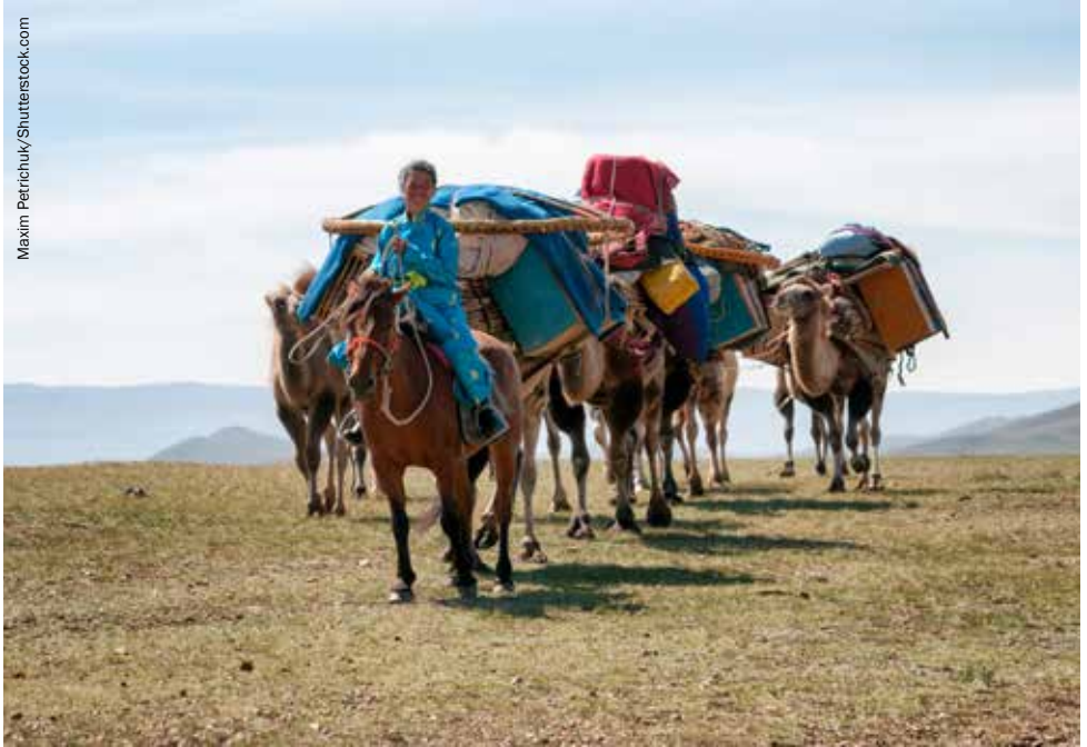
Une caravane de chameaux transportant les tentes démontées de nomades mongols vers un nouvel emplacement dans le nord du pays.

ou chauds, la capacité à trouver suffisamment de fourrage pour engraisser les animaux est un défi sempiternel. L'évolution des schémas climatiques, le caractère saisonnier des précipitations et la recharge des eaux souterraines sont des éléments cruciaux de la viabilité de l'élevage. À Oman, une augmentation annuelle des températures de 0,6°C et un déclin de 21 % des précipitations entre 1990 et 2008 ont rendu l'eau encore plus rare et accentué l'évapotranspiration dans l'intérieur pastoral du pays, ce qui s'est traduit par plusieurs tempêtes catastrophiques et une réduction du rendement écologique. Les structures construites pour les industries extractives ont également restreint les mouvements et l'accès à l'eau. Parallèlement, la Mongolie a connu un réchauffement progressif de l'ordre de 2°C depuis 1940, des sécheresses récurrentes, des modifications du régime des précipitations et de leur saisonnalité, et un déclin des sources d'eau. L'impact néfaste du changement climatique se manifeste dans la pauvreté rurale et les migrations vers les villes qui en résultent.