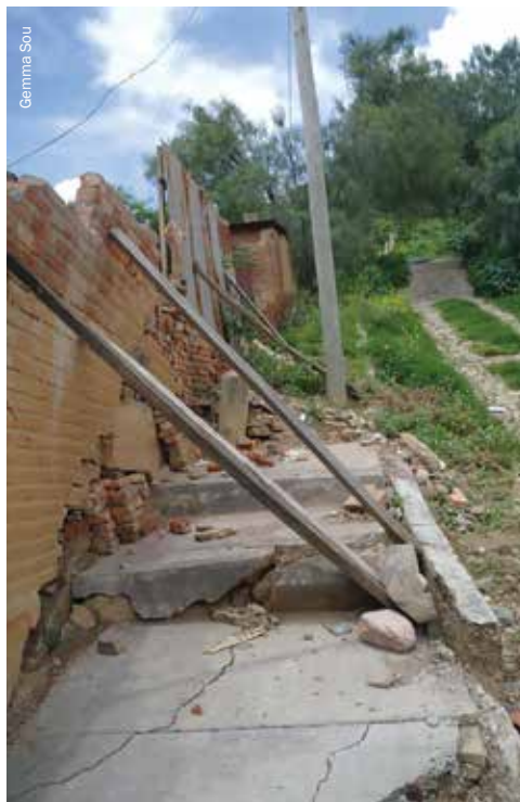
Des planches soutiennent un mur après un glissement de terrain à Cochabamba.

d'identité et d'appartenance qui tend à fortement dissuader les gens de se réinstaller ailleurs.