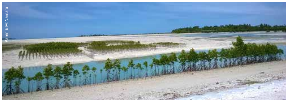
La plantation de palétuviers à Tarawa, capitale de Kiribati, aide à protéger le littoral de la montée du niveau de la mer et des tempêtes.

Karen E McNamara karen.mcnamara@uq.edu.au est maître de conférences à la School of Geography, Planning and Environmental Management de l'Université de Queensland. www.gpem.uq.edu.au