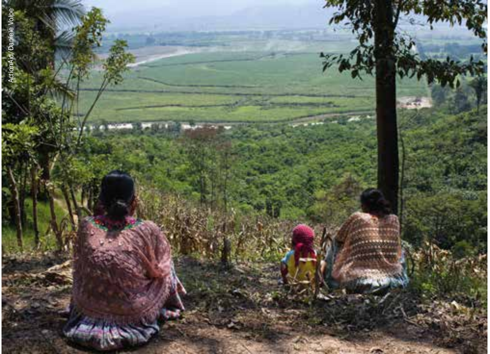
ActionAid/ Daniela Volpe

Des membres de la communauté K'Quinich dans la vallée du Polochic, au Guatemala, regardent les terres dont ils ont été expulsés.