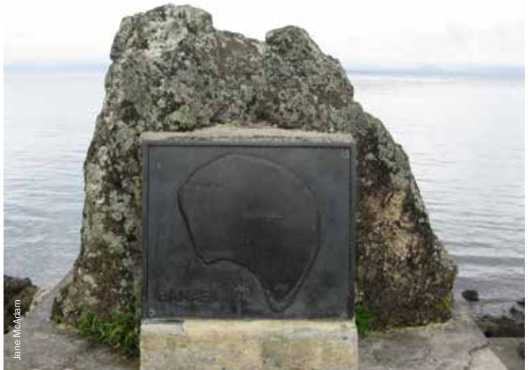
Un monument sur l'île de Rabi (Fidji) montrant une carte de Banaba (Kiribati), l'île natale des Banabéens qui se sont réinstallés à Fidji en 1945.

Ces facteurs contribuent à expliquer pourquoi – en dépit du soutien de champions politiques puissants et de propositions théoriques élaborées – la réalité concrète de la réinstallation transfrontalière à grande échelle s'est trouvée beaucoup plus limitée que les visions qui la sous-tendaient. Des propositions de projets de réinstallation en Alaska, aux Philippines,