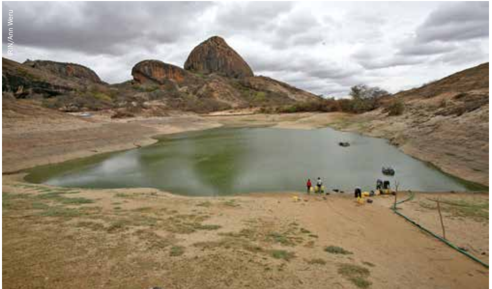
Le barrage de récupération des eaux de roche de Ngomeni, dans le district de Mwingi au Kenya, qui dessert des centaines de ménages, à sec pour la première fois depuis de nombreuses années en 2011, selon les résidents.