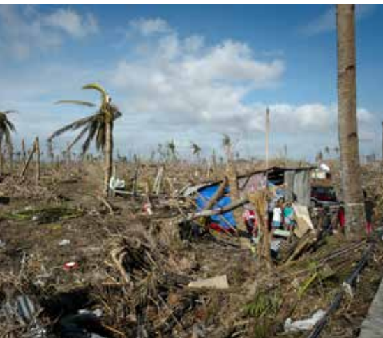
Destructions occasionnées par le typhon Haiyan dans la ville de Tanauan aux Philippines, novembre 2013.

L'aggravation de la pauvreté dans tous les sites de réinstallation est le résultat de l'effondrement