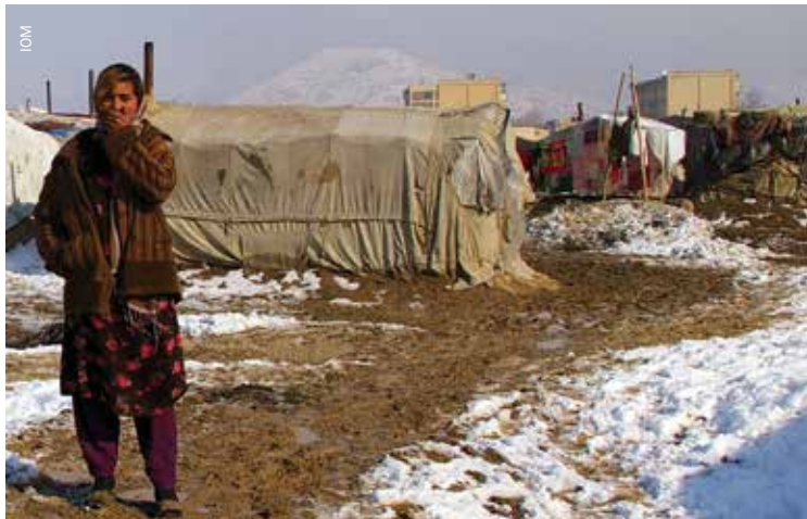
اوبه په کابل کې

د پراخې ونډې اخستې جلیول: د بې ځايه شويو د پالیسي کاري گروپ چې د مهاجرینو د وزارت سره به په مشورتي او د مسودې د جوړول په پروسو کې همکاري کوي، یوه وړوکې ډله وه چې ډیری غړي یې نړیوالې بشردوستانه اېجنسیانې وې. هغه هڅې هم ناکامې وې چې غوښتل یې په دې کار کې د افغانستان د بشر د