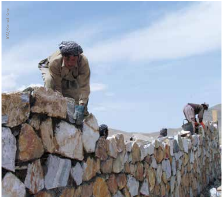
د افغانستان په غزني کې پر يوې نوې شفاخانې ساختماني کار پيلیږي.

کله چې ترې پوښتنه وشوه ډيری افغانانو په ۲۰۱۴ کال کې د نړيوالې ټولني د توجه په سر شک ښکاره کړ او ويل يې چې دا کار د افغانستان د لنډ راتلونکي لپاره ډير مهم دی. يو دليل د کارونو ځنډول دي او صبر کول دي چې څه به پيښيږي. ځينو ساحاتو ته اوليت ورکړل شوی دی لکه اداري فساد، د ښځو حقونه، مخ په لوړيدو بې کاري، د محلي حکومت ظرفيت، او د پانگه اچونکو اطمینان حاصلول. او بې ځايه کيدنې ته هم لومړيتوب ورکړل شوی دی. دا چې ۲۰۱۴ کال به نورې بې ځايه کيدنې هم منځ ته