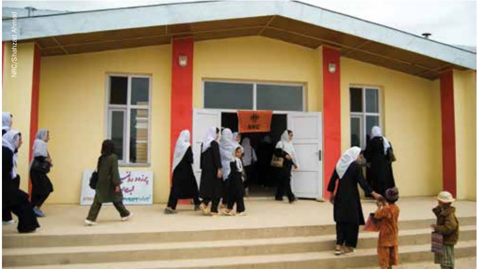
د فاریاب د ولایت په میمنه کې راستنیدونکې، بې ځايه شوي او محلي انجونې په هغه مکتب کې د درس ویلو په حالت کې دي چې د ناروي د کډوالو د کونسل لخوا جوړ شوی دی.

ځای کېدو سره مساوي نه ده بلکې په مناسب وخت کې رضاکاره بېرته ستیدو په عرصه کې هم رول لوبولی شي.