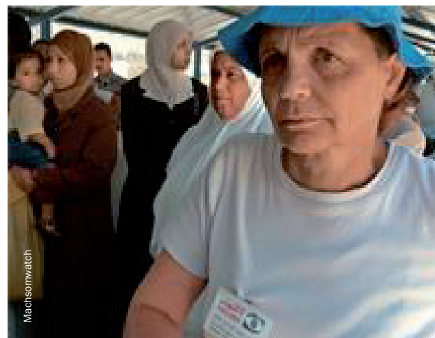
ישראלית עוקבת אחר הפרות של זכויות אדם במחסום

אמנת ז'נבה הרביעית, שנכנסה לתוקף באוקטובר 1951, ייצגה את שאיפותיה של הקהילייה הבינלאומית להציע הגנה של קבע לאזרחים החיים תחת כיבוש צבאי לאחר מלחמת העולם השנייה. החריגה של ישראל מהאמנה אל מול הפלסטינים החיים תחת הכיבוש היא משמעותית, והיא מפירה את מרבית סעיפי המפתח של האמנה באקראי או בשיטתיות. בטענה שהשטח שהיא מכנה "יהודה ושומרון" הוא "שטח מריבה" ולא שטח כבוש, אין