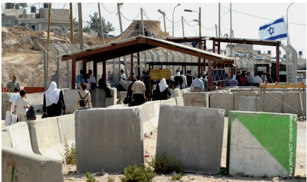
מחסום ישראלי ליד מחנה הפליטים קלנייה

שיטות האכיפה של הסגר הפכו מתוחכמות יותר ויותר, והן מנתבות את התנועה הפלסטינית במידה גוברת והולכת לעבר דרכים מקומיות, צרות יותר. כך נותרים הכבישים הראשיים – שרובם נבנו זה לא מכבר למטרה זו – לשימוש הבלעדי של מתנחלים ישראלים העושים דרכם