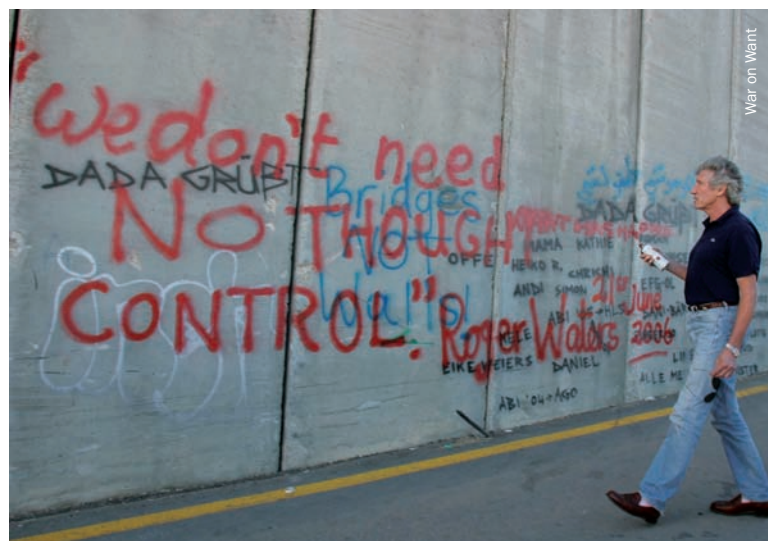
War on Want