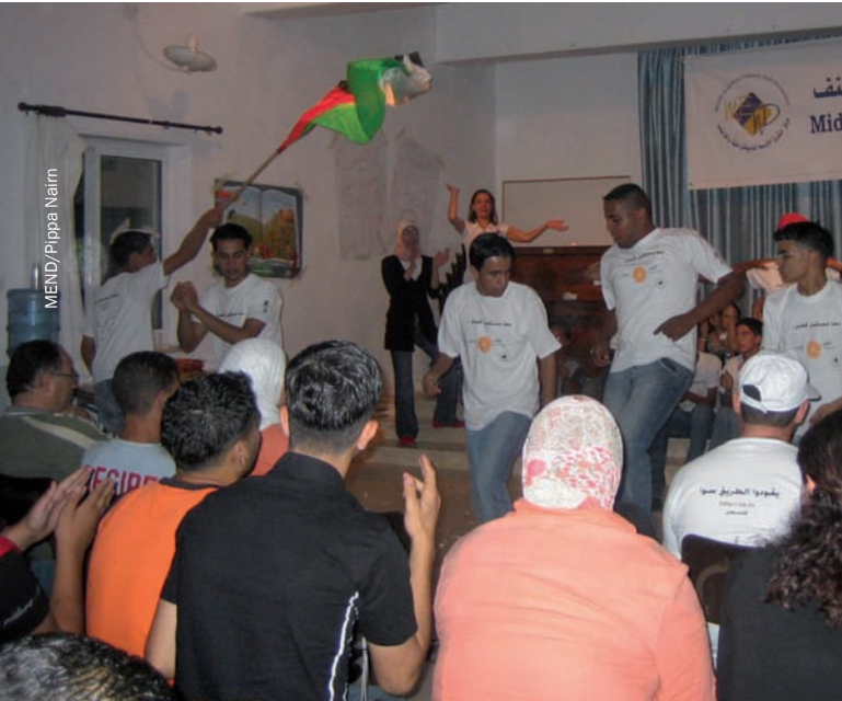
מחנה קיץ של נוער פלסטיני מהגדה המערבית, הקמתה של תנועת נוער לאומית במסגרת התנועה לאי-אלימות ולדמוקרטיה (MEND)

נהגתי לברוח מבית-הספר. משפחתי הייתה אותי כדי להכריח אותי ללכת ללמוד. השתמשתי באלימות נגד בני כיתתי, בעיקר נגד אלה שחשבת שהם טובים ממני. הואיל והקהילה שבה נולדתי וגדלתי מקדשת מעשי גבורה של בודדים, באופן לא-מודע שאפתי להפוך לגיבור שכוה. כאשר הייתי בן עשרה, פוליטיקה, או יותר נכון אלימות פוליטית, הפכה לחלק מחיי. נהגתי להשליך אבנים אל עבר כלי רכב של כוחות הכיבוש שסירו ברחובות עירי. כשהייתי בן 14 נעצרתי למשך שלושה ימים. עוניתי קשות במעצר. נעשיתי אלים אף יותר. האלימות התפתחה אצלי כתגובת נקם. במהלך האינתיפאדה הראשונה הייתי קורבן למדיניות "שבירת