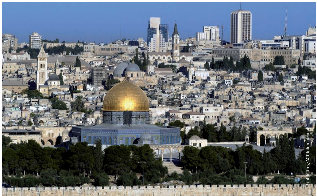
Paul Jeffrey/ACT International

החומה, המזדקרת לגובה של שמונה מטרים, איפשרה לישראל להשיג את מטרותיה משכבר במסווה של צורכי ביטחון. ירושלים עומדת בלב הקונפליקט במזרח התיכון. לשתיקה הבינלאומית ולהימנעות מלצאת בגלוי נגד מדיניות הטרנספר הישראלית יש