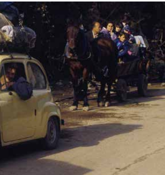
Bosanske izbjeglice se vraćaju u Veliku Kladušu iz kampa Kuplensko u Hrvatskoj, decembar 1995.