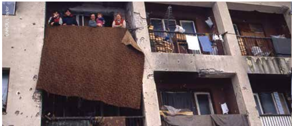
Kolektivni centar u Hrasnici, 1995.

“Puno se svađaju. Udaraju se kao da su na Diviljem zapadu.”