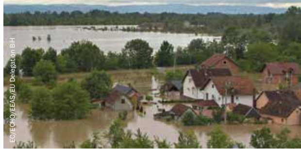
Fotografija koju je napravila slovenačka helikopterska ekipa dok su pružali pomoć ljudima pogođenim poplavama u Bosni i Hercegovini 2014.

Konačno, Federalno ministarstvo raseljenih osoba i izbjeglica – iz jednog od dva entiteta koji upravljaju BiH – preusmjerilo je sredstva namijenjena osobama raseljenim sukobom i iskoristilo ih da se prvo pomogne ljudima koji su dvostruko raseljeni, jednom zbog suboka i onda ponovno zbog poplava i klizišta. Najveće pitanje se