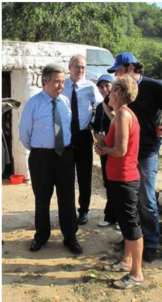
Visoki povjerenik za izbjeglice António Guterres u posjeti povratnicima koji čekaju na pomoć pri obnovi, Srebrenica, august 2009.

Treći i konačni plan počeo je izradom Revidirane strategije za provedbu Aneksa