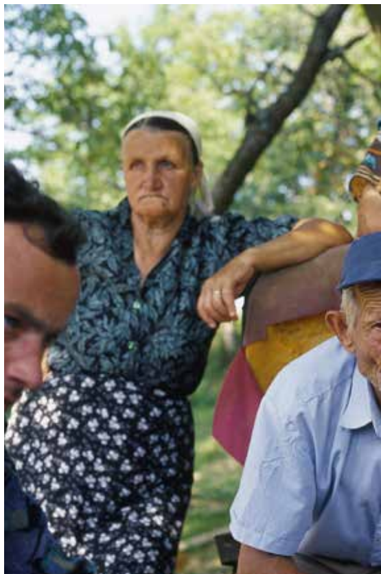
Miješane grupe srpskih i hrvatskih povratnika u selu Bukve, 2001.

Članom IV Aneksa 3 Dejtonskog mirovnog sporazuma propisano je da se "od državljana koji više ne žive u općini u kojoj su prebivali 1991. očekuje da u toj općini glasaju, bilo lično bilo u odsutnosti." 43 Ova odredba o izborima omogućila je izbjeglicama