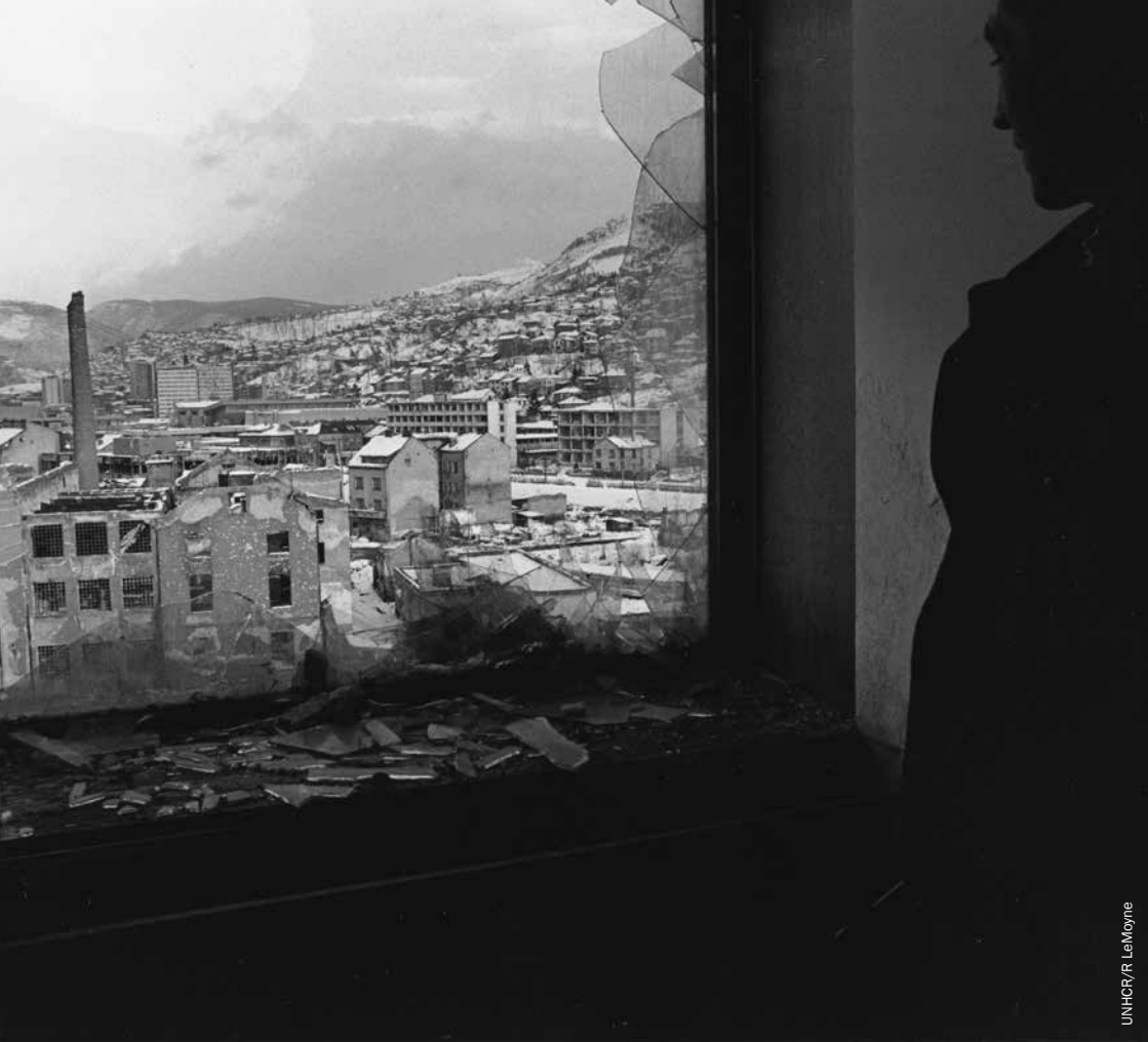
Pogled na Sarajevo sa uništene zgrade parlamenta, 1996.

je očajnički trebala zaštita. Sa tačke gledišta zemalja domaćina, to dokazuje da je privremena, opsežna humanitarna zaštita moguća. Historija humanitarne zaštite u BiH osobito je relevantna za današnje užase sukoba u Siriji koji je uništio većinu zemlje i prouzrokovao raseljenje više od osam miliona ljudi. Dok se zemlje članice Evropske unije još uvijek ne mogu složiti oko premještanja 60.000 sirijskih izbjeglica, bosansko iskustvo