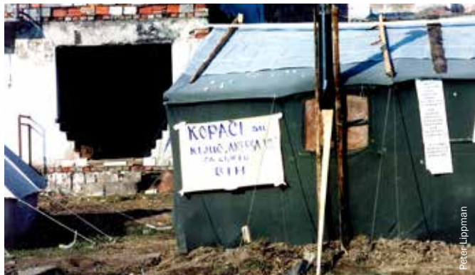
Natpis na šatoru: 'Kopači su ključ Aneksa 7 za cijelu Bosnu i Hercegovinu'. Šatorsko naselje nadomak Goražda, iznad sela Kopači. Novembar 1999.

Da bi odgovorili na ovakav pritisak, međunarodni zvaničnici konačno su počeli