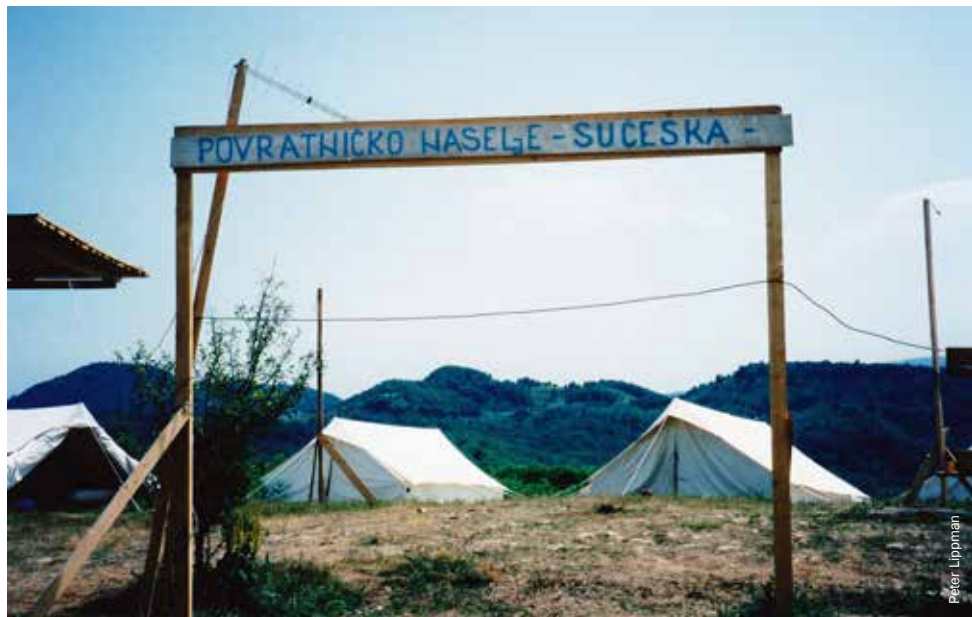
Na kapiji piše: 'Povratničko naselje Sućeska'. Sućeska je selo u općini Srebrenica i bilo je prvo povratničko naselje u toj općini. Juni 2000.

povratak svojih zajednica. Mnoge organizacije imale su podršku i lokalnog stanovništva i međunarodne zajednice, ali potencijalni povratnici suočavali su se sa opstrukcijom i zastrašivanjem od lokalnih vlasti i drugih ljudi koji su pritajeno pokušavali sabotirati pokušaj povratka. Oštećene kuće obnovljene su da bi potom ponovo bile granatirane, a povratnici su ubijani ili zastrašivani kako bi odustali i ponovo otišli. Mine su postavljane na putevima u Gackom i Stocu. Krajem 1999. godine, jedan rani povratnik u Srebrenicu, zaposlenik u općinskom vijeću, zboden je i ostavljen da umre u zgradi općine. U istom periodu došlo je do spaljivanja desetina obnovljenih domova.