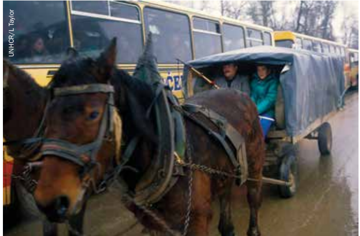
Bosanske izbjeglice se vraćaju u Veliku Kladašu iz kampa Kuplensko u Hrvatskoj, decembar 1995.

Tenzija između pristupa zasnovanog na pravima koji je impliciran Dejtonskim