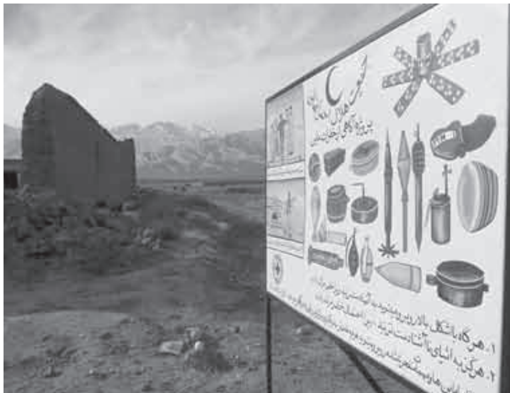
تشكل الألغام في أفغانستان تهديداً كبيراً للعائدين

ومن أكبر التحديات التي واجهت أوضاع ما بعد الصراعات، خلق بيئة مواتية لعودة النازحين وإعادة إدماجهم. وعادة ما تعج البيئة التي تخلفها الصراعات بالسلاح وخاصة الأسلحة الخفيفة. ويشكل إرساء الأمن وحكم القانون ركيزة أساسية لنجاح عمليتي العودة وإعادة الإدماج. ويعتبر تسريح المقاتلين ونزع سلاحهم وإعادة دمجهم عنصراً أساسياً لتحقيق ذلك. وقد يؤدي وجود المليشيات، التي يتزعمها القادة الحربيون المحليون والتي