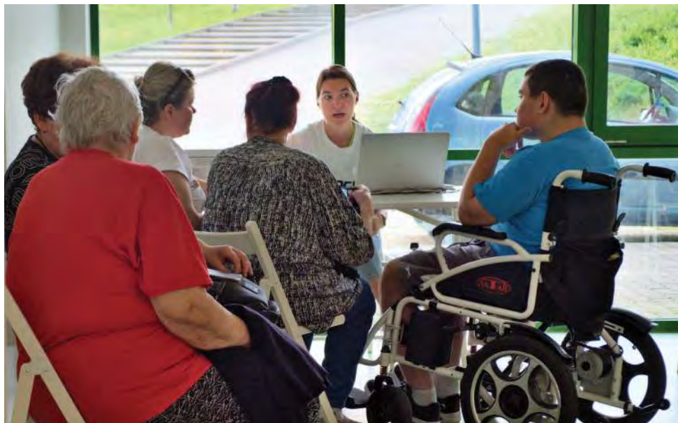
Центр регистрации в Люблине, где Польский центр международной помощи (PCPM), партнер Норвежского совета по делам беженцев (NRC) реализует проект «Денежная помощь украинским беженцам из числа уязвимых групп в Польше».

находятся в таких отраслях, как транспорт и строительство, которые не подходят для жизненного распорядка тех, кому приходится ухаживать за близкими. Более того, имеющиеся рабочие места в основном относятся к низкой квалификации или ручному труду. Многие украинские беженцы являются высококвалифицированными специалистами: 66% из них имеют высшее образование, и только 15% имеют низкую квалификацию. 6 Получение работы, не соответствующей их навыкам и способностям, в долгосрочной перспективе может негативно сказаться на их экономической самостоятельности. Кроме того, многие украинцы не хотят соглашаться на более высокооплачиваемую долгосрочную работу, а работодатели не хотят ее предлагать, поскольку те намерены вернуться на родину, как только обстановка там станет спокойной и безопасной.