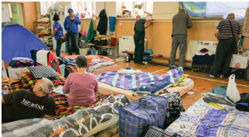
Школа № 6 в Ужгороде (Украина) — одна из многих, переоборудованных под временные убежища для перемещенных лиц.

Что касается перемещения населения, то принудительное перемещение не только имело место, но и носило массовый характер. Более того, в значительной степени это перемещение приобретает затяжной характер. С 24 февраля 2022 года в Европе было зарегистрировано более восьми миллионов беженцев. По состоянию на 25 мая 2023 г., по оценкам Международной организации по миграции (МОМ), на территории Украины остаются перемещенными 5,1 млн. человек, а 60% всех ВПЛ в стране заявляют о том, что они были перемещены на один год или дольше. 4 Условия для безопасного и достойного возвращения в Украину пока