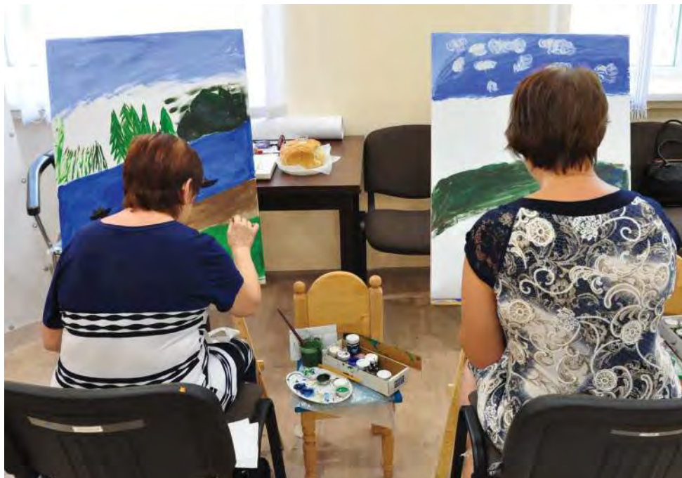
В рамках программы, проводимой принимающей общиной, для ВПЛ было организовано пространство для проведения мастер-классов, в том числе по живописи, 2017 г.

восстанавливать свою жизнь, но в то же время отметила достижения своей семьи: