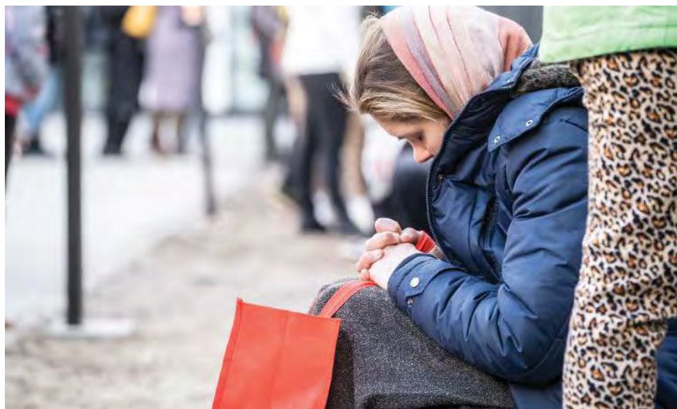
Беженцы из Украины ожидают регистрации для получения денежной помощи в Варшаве, Польша, март 2022 г.

Национальные сети PSEA также сыграли ключевую роль в укреплении потенциала других участников. На момент написания статьи УВКБ ООН и его партнеры обучили по программе PSEA более 5000 работающих на местах сотрудников в соседних странах. Обучение прошли также сотрудники центров приема беженцев, волонтеры, сотрудники колл-центров, пограничники и полицейские.