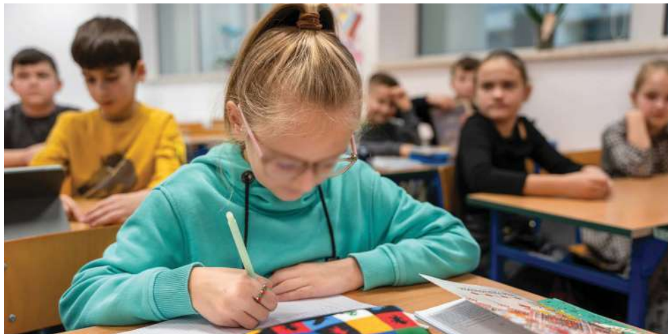
Яна, 9 лет (имя изменено) Украинская школа, Варшава.

рассказывали о конфликте, описывали просмотренные ими видеоматериалы. Судя по всему, дети постоянно находятся под воздействием ситуации в Украине. Для некоторых из них это усугубляется воспоминаниями о травмирующих событиях, таких как атака на их дома и их разрушение; другие отмечают, что их пугают громкие звуки.