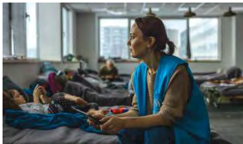
В Польше наблюдатель УВКБ ООН по вопросам защиты оценивает потребности беженцев из Украины.

Государства в Европе и за ее пределами продемонстрировали, что у них есть инструменты, возможности и «пространство» для защиты и интеграции беженцев, а также для эффективного управления крупномасштабными перемещениями населения. В той или иной степени беженцы получили доступ к различным службам и национальным системам социальной защиты, вышли на рынок труда, обрели самодостаточность и довольно быстро и продуктивно стали вносить свой вклад в социальную среду принимающих сообществ, хотя в различных принимающих странах это происходило по-разному. Политическая воля и готовность, продемонстрированные европейскими государствами и региональными структурами, получили поддержку со стороны муниципальных властей и гражданского общества.