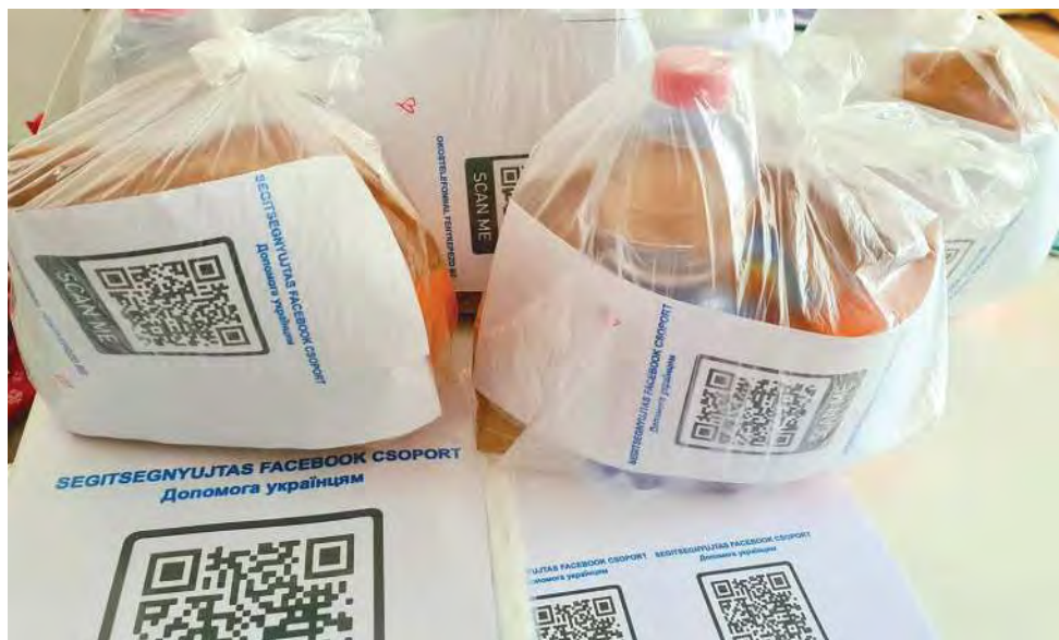
В продуктовые наборы, раздаваемые на пограничных переходах и железнодорожных станциях, помещались QR-коды группы в Facebook, чтобы беженцы могли сразу связаться с сотнями тысяч местных помощников.

сообщений из более чем 50 точек, где осуществлялась координация действий по оказанию помощи — от мэров провинциальных городов, гуманитарных организаций и координаторов работы волонтеров на вокзалах и в аэропортах. Затем RHDN публиковала объявления на нескольких языках о необходимых пожертвованиях, пунктах распределения, приютах и т.д., обобщая ключевую информацию и используя при этом простую терминологию.