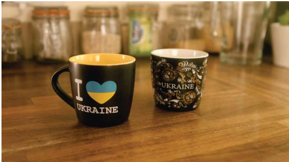
Подарки, привезенные беженцами из Украины для принимающих их лиц в Великобритании.

Долгосрочное проживание: Отсутствие доступного социального жилья и недорогой частной арендной недвижимости для украинцев, куда они могли бы переехать после окончания срока проживания в рамках ДДУ, заставило многих хозяев и гостей обратиться к правительству с просьбой о срочной помощи беженцам, пытающимся найти подходящее жилье на длительный срок. Большинство хозяев по-прежнему проявляют огромную добрую волю и готовы продлить сроки размещения, однако все больше беженцев не имеет надежного жилья.