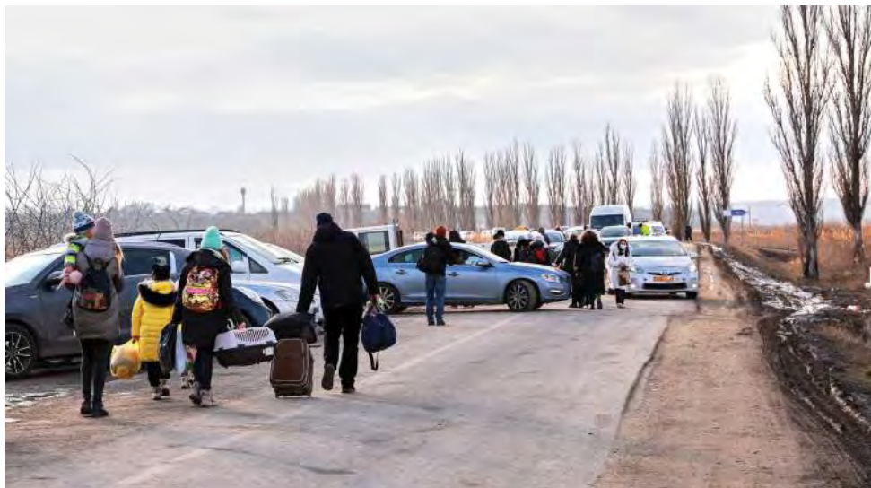
Сцена с пункта пропуска Паланка-Маяки-Удобное на границе между Республикой Молдова и Украиной 4 марта 2022 г.

предоставления жилья, поскольку многие беженцы не могут обеспечить себя жильем за счет собственных средств. В случае прекращения жилищной программы существует риск перегрузки центров коллективного размещения, кроме того, это может привести к напряженности в отношениях с принимающим сообществом в связи с ценами на аренду и доступностью жилья.