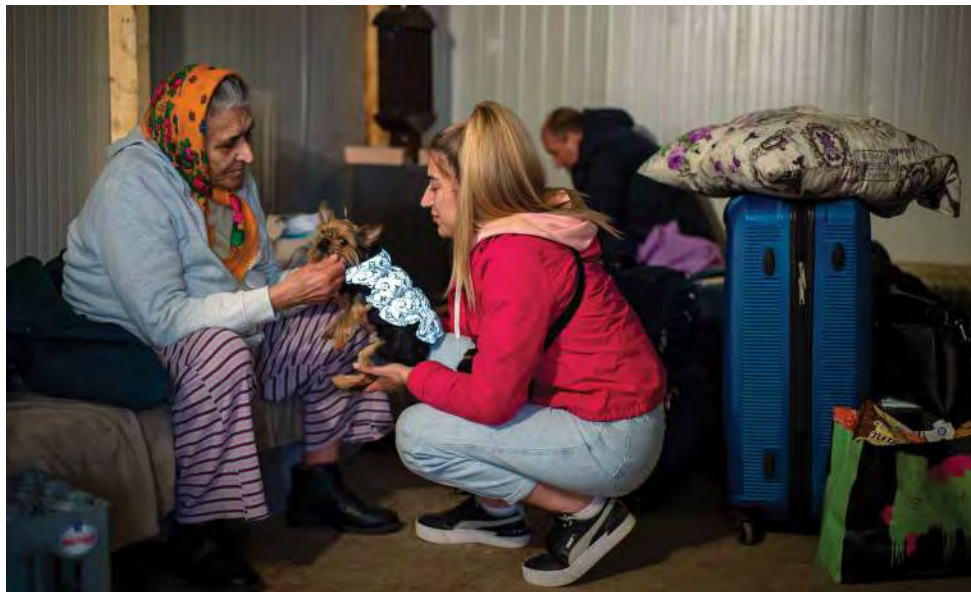
Украинские беженцы в ожидании на украинско-румынском пограничном пункте Порубное-Сирет, март 2022 г.

процесса интеграции лиц - обладателей статуса временной защиты.