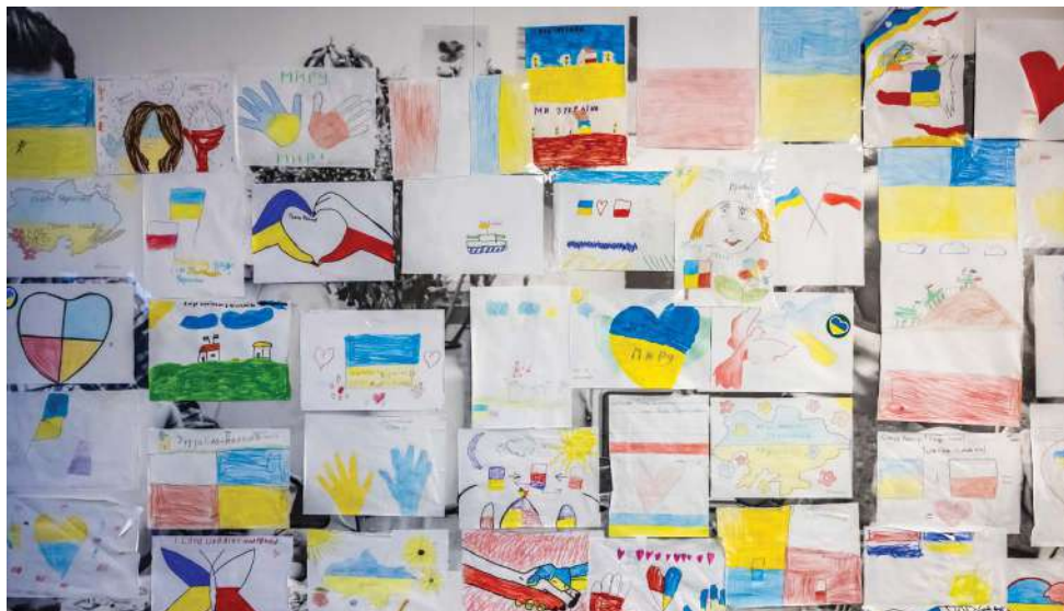
Рисунки детей из Украины, сделанные ими в приюте в Кракове, декабрь 2022 г.

для регулирования огромного спроса на регистрацию и услуги во время кризиса с украинскими беженцами, способны повысить эффективность национальных систем предоставления убежища. Наконец, данный опыт подчеркивает важность обеспечения возможных «стратегий выхода» из временной защиты и перехода к другим формам правового статуса, которые обеспечивают соблюдение прав беженцев в соответствии с международным правом, сохраняя при этом некоторые из наиболее заметных достижений всего проекта — необычайный уровень солидарности, сотрудничества и распределения нагрузки, продемонстрированный государствами-членами ЕС.