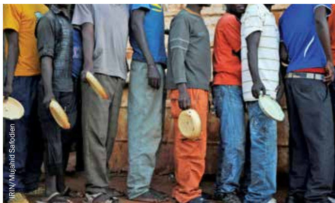
Migrantes y solicitantes de asilo en el refugio para hombres «Yo creo en la Iglesia de Jesús», en la ciudad fronteriza sudafricana de Musina haciendo cola para una comida caliente gratis, proporcionada por el ACNUR.