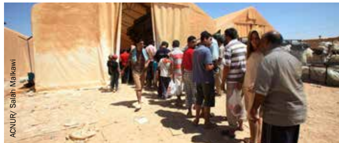
Refugiados sirios, Za'atari, Jordania

www.fmreview.org/es/detencion/arnoldfernandez-pollock