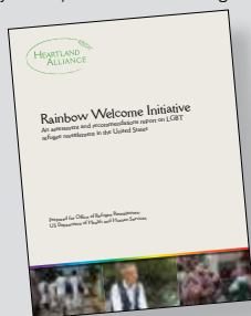
Rainbow Welcome Initiative assessment report (Informe de evaluación de la Iniciativa Bienvenida Arco Iris) http://tinyurl.com/HAI-Rainbow-Assessment