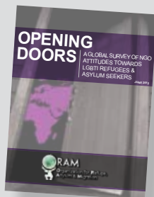
Opening Doors (Abriendo puertas) http://tinyurl.com/ORAM-Opening-Doors-2012