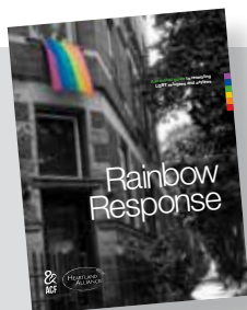
Rainbow Response (La Respuesta Arco Iris) http://tinyurl.com/HAI-Rainbow-Response