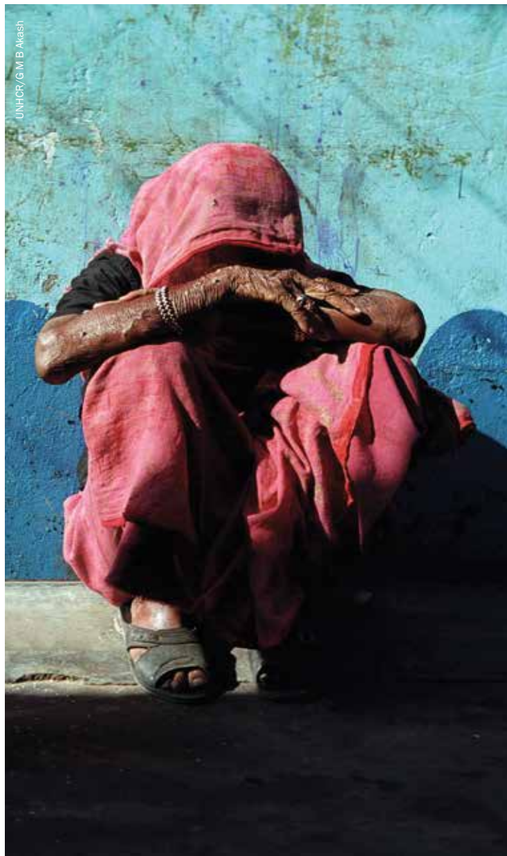
Après que leur citoyenneté a été confirmée, les Biharis du Bangladesh ont aujourd'hui l'espoir de vivre une vie normale après des années d'exclusion.

www.fmreview.org/fr/afghanistan/dechickera-whiteman